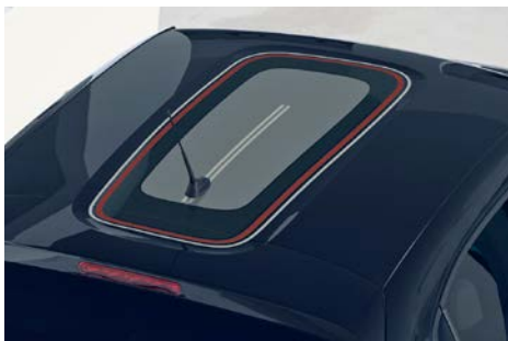
Nálepka na streche v štýle C-SERIES