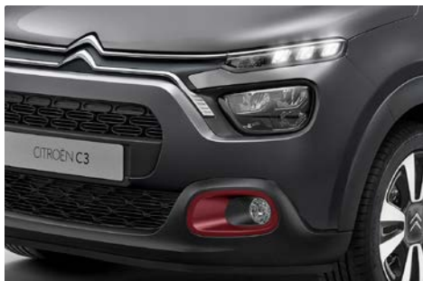
Orámovanie hmlových svetlomietov v červenej farbe REGAL RED.