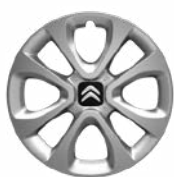
Okrasný kryt ARROW 15"