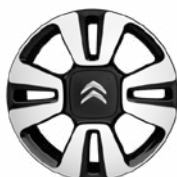
Disk MATRIX 16"