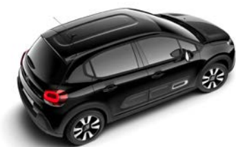
Čierna PERLA NOIR