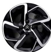
Disk BITON HELLIX 16"