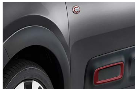
Červený prvok na Airbumppe