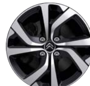
Disk VECTOR 17"