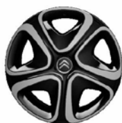
Okrasný kryt 3D 16"