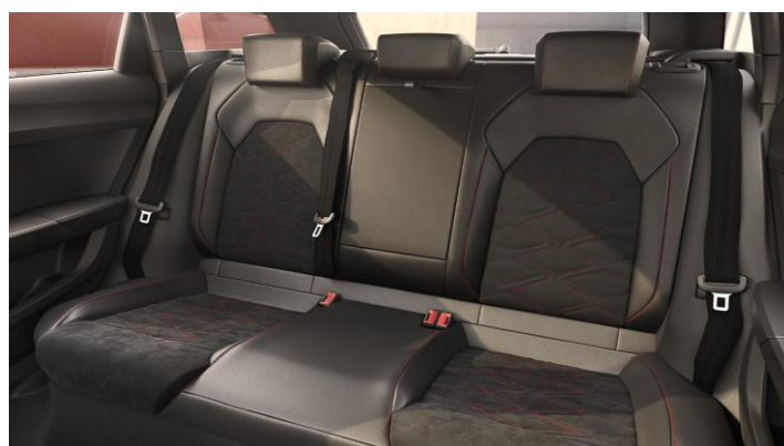
Zadné sedadlá so sklopnou lakťovou opierkou (na obr. výbava FR s poťahmi Dinamica (WL3))