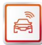
SEAT SERVICE MOBILITY