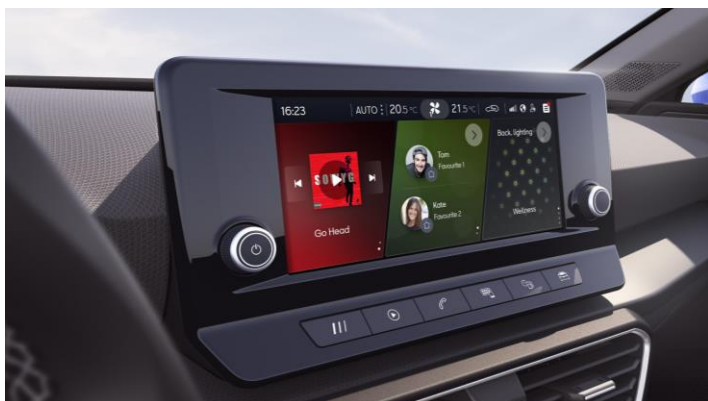
Media Systém PLUS, displej 8,25" (na obr. výbava Style)

• sériová výbava , + výbava balíkov PREMIUM