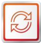
ORIGINÁLNE VÝMENNÉ DIELY SEAT