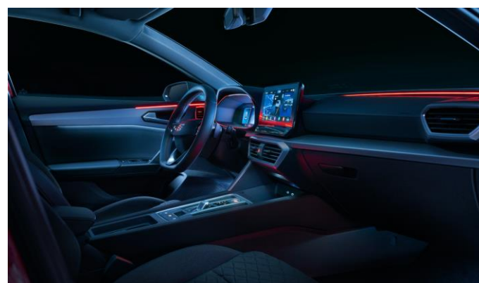
Inteligentné ambientné osvetlenie PLUS