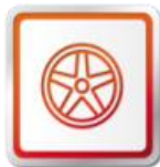
ORIGINÁLNE PRÍSLUŠENSTVO SEAT