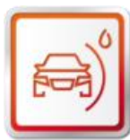
ZÁRUKA NA PREHRDZAVENIE Z VNÚTRA 12 ROKOV