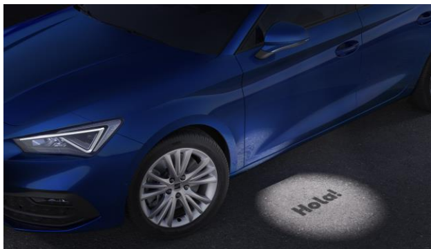
Uvítacie osvetlenie vo výbave Full LED HIGH