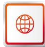
SIĽ SEAT SERVISOV SEAT