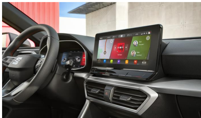
Full Digital Cockpit + navigácia PLUS s 10" displejom (na obr. výbava FR)