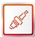
ORIGINÁLNE DIELY SEAT