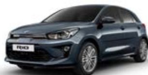
Smoke Blue (metalický lak)