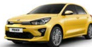
Most Yellow (metalický lak)