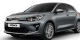
Perennial Grey (metalický lak)