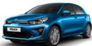
Sporty Blue (metalický lak)