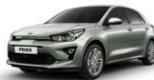
Urban Green (metalický lak)