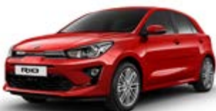
Signal Red (metalický lak)