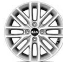
15 palcové disky kolies z ľahkých zliatin (pneumatiky 185/65R15)