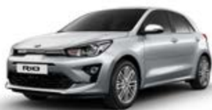
Silky Silver (metalický lak)