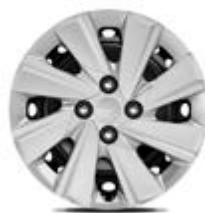
15 palcové ocelové disky kolies s okrasnými plastovými krytmi (pneumatiky 185/65 R15)