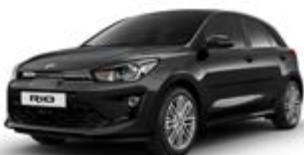
Aurora Black Pearl (metalický lak)