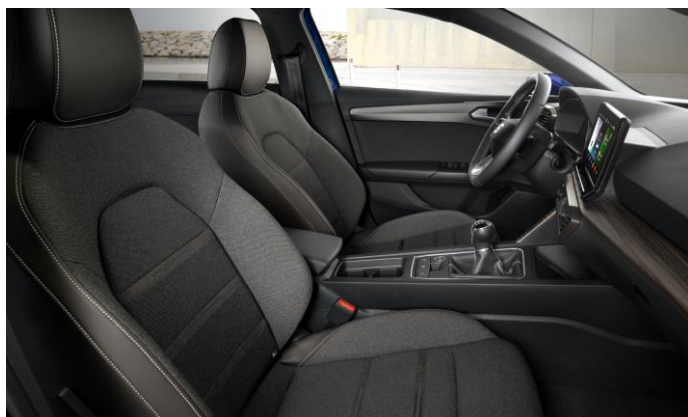
Výbava Xcellence s manuálnou prevodovkou

* hlasové pokyny a ovládanie dostupné iba vo vybraných jazykoch (napr. čeština, angličtina, nemčina, ...)