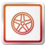
ORIGINÁLNE PRÍSLUŠENSTVO SEAT