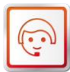
STAROSTLIVOSŤ O ZÁKAZNÍKOV