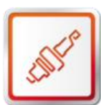
ORIGINÁLNE DIELY SEAT