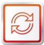
ORIGINÁLNE VÝMENNÉ DIELY SEAT