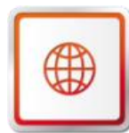
SIEŤ SERVISOV SEAT