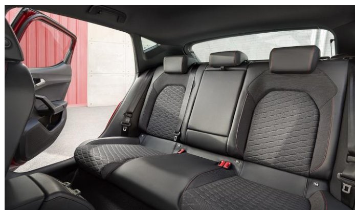
Zadné sedadlá so sklopnou lakťovou opierkou (na obr. výbava FR)