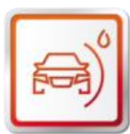
ZÁRUKA NA PREHRDZAVENIE Z VNÚTRA 1 ROKOV