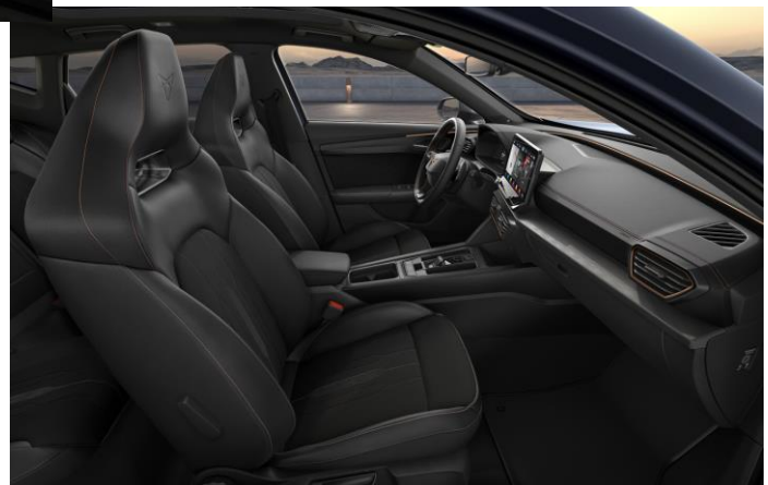
Sériové poťahy pre Formentor Veloz