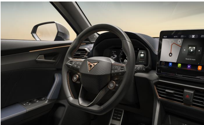
Volant Supersport (P1V)

Chceme, aby ste si automobil CUPRA užívali čo možno najdlhšie. Preto okrem 3-ročnej záruky na lak poskytujeme 12-ročnú záruku proti prehrdzaveniu z vnútra. Modely značky CUPRA majú plne-pozinkovanú karosériu čo ich činí odolnými voči všetkému, čo na vás prírodné živly môžu zoslať.