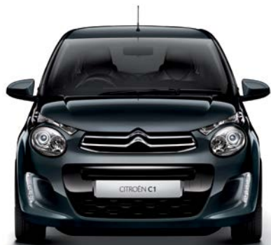
Sivá CARLINITE (M)