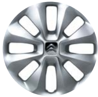
COMET Okrasný kryt 15"