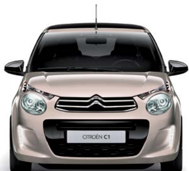
Běžová NUDE (N)