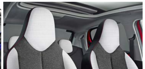
LÁTKA CURIBITA TRITON URBAN RIDE