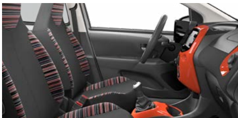
LÁTKA ZEBRA RED