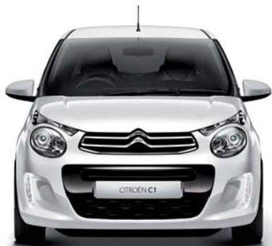
Bielá LIPIZAN (N)