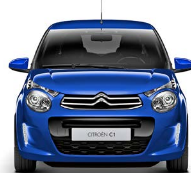
Modrá CALVI (M)