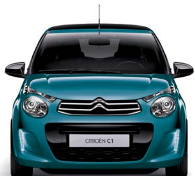
Modrá EMERAUDE (M)

M – metalická farba; N – nemetalická farba