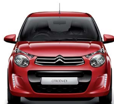
Červená SCARLET (N)