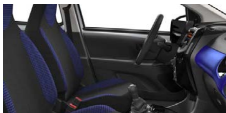
LÁTKA SQUARE BLUE