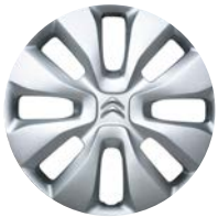
STAR Okrasný kryt 14"