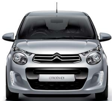
Sivá GALLIUM (M)