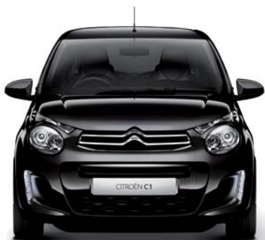
Čierna CALDÉRA (M)