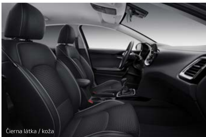
Čierna látka / koža