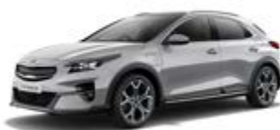
Sparkling Silver (metalický lak)