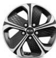
205/60R16-palcové disky kolies z ľahkých zliatin / Gold

DISKY KOLIES (disponibilné v závislosti od stupňa výbavy) >>>