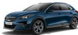
Cosmos Blue (metalický lak)