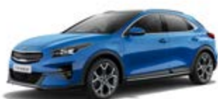
Blue Flame (metalický lak)