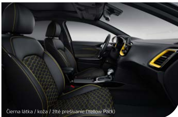
Čierna látka / koža / žlté prešívanie (Yellow Pack)