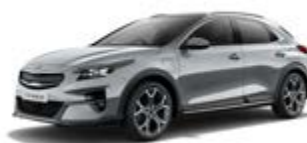
Lunar Silver (metalický lak)