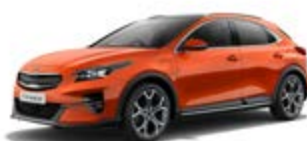
Orange Fusion (metalický lak)