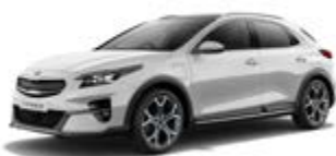
Deluxe White (metalický lak)