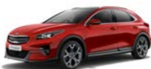
New Infra Red (metalický lak)