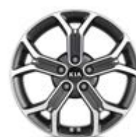
235/45R18-palcové disky kolies z ľahkých zliatin / Platinum