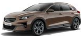
Cooper Stone (metalický lak)