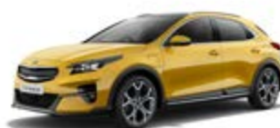
Quantum Yellow (metalický lak)

DISKY KOLIES (disponibilné v závislosti od stupňa výbavy) >>>