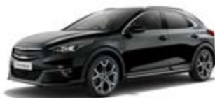
Black Pearl (metalický lak)