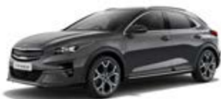
Penta Metal (metalický lak)