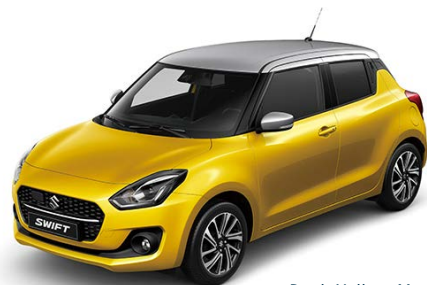
Rush Yellow Metallic -Premium Silver Metallic (D8A)