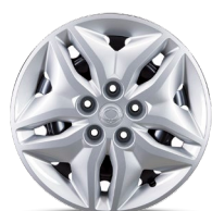
16" oceľové disky s pneumatikami 205/65R