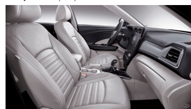
Svetlo šedý dvojtónový interiér (EBG)