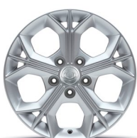
16" ALU disky, pneumatiky 205/65 R16