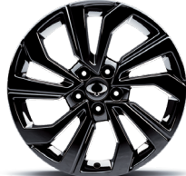
18" ALU čierne disky "Diamond Cut" (čierna) s pneumatikami 215/50R