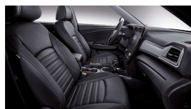
Čierny interiér (LBH)