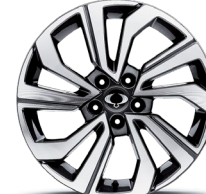
18" ALU disky "Diamond Cut" (strieborné) s pneumatikami 215/50R