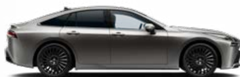
1L5 Striebornosivá špeciálny lak 900 €