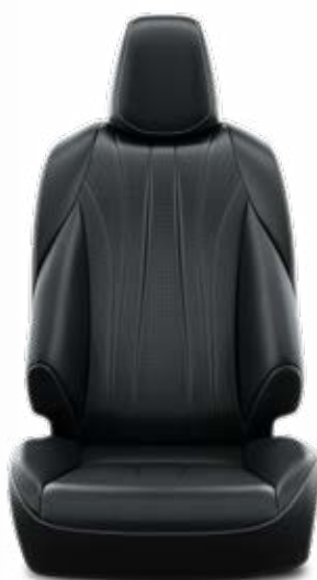
Čalúnenie z prírodnej kože čierne Pre paket VIP