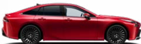
3U5 Červená – karmínová špeciálny lak 900 €