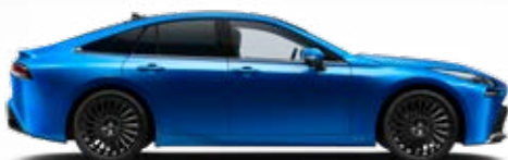
8Y7 Modrá – žiarivá špeciálny lak 900 €