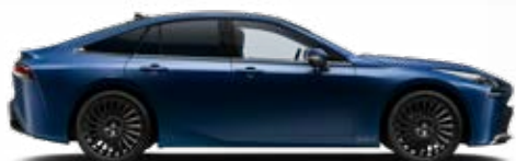
8S6 Modrá – nočná metalický lak bez príplatku