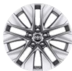
19" zliatinové disky kolies, pneumatiky 235/55 Pre výbavu Comfort