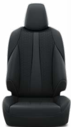
Textilné čalúnenie čierne Pre výbavu Comfort