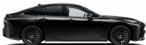
219 Čierna – klasická špeciálny lak 900 €