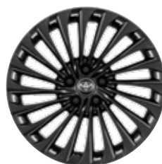
20" zliatinové disky kolies, pneumatiky 245/45 Pre paket VIP