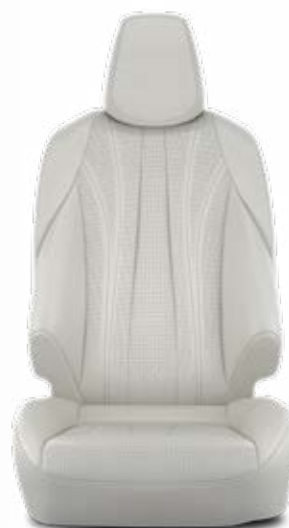
Čalúnenie z prírodnej kože svetlé Pre paket VIP