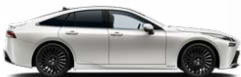
090 Biela – perleťová špeciálny lak 900 €