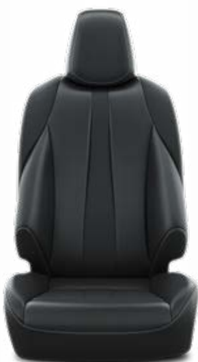
Čalúnenie zo syntetickej kože Pre výbavu Executive