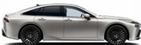
1J6 Strieborná – zamatová špeciálny lak 900 €