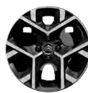
Disk z ľahkej zliatiny ORIGAMI 17" s výbrusom