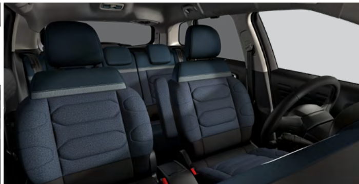
URBAN BLUE (1JFM)