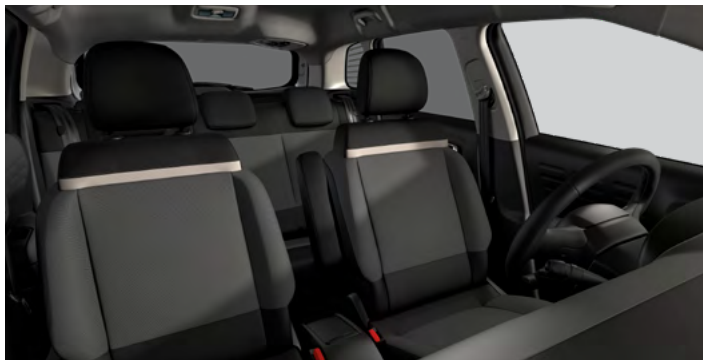
ŠTANDARDNÝ INTERIÉR (4YFT)