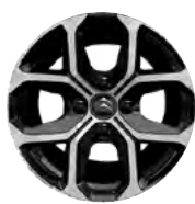
Disk z ľahkej zliatiny X CROSS 16" s výbrusom