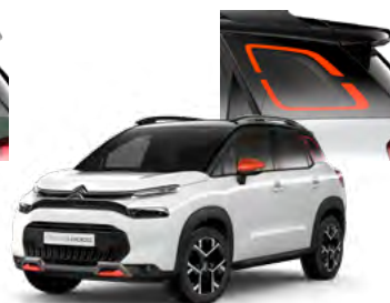
PACK COLOR – ORANŽOVÝ