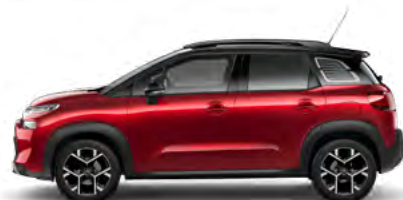
ČERVENÁ PEPPERONCINO (M)