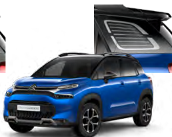
PACK COLOR – ČIERNY