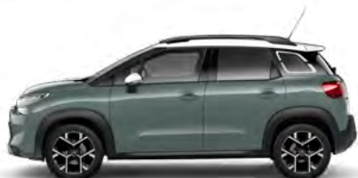
SIVÁ KAKI (M)