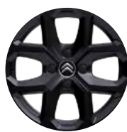
Disk z ľahkej zliatiny X CROSS 16" čierny