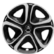
Okrasný kryt STEEL & STYLE 3D 16"