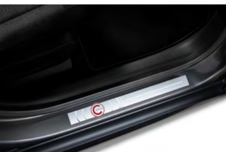
Prah dverí s motívom limitovanej edície C-SERIES