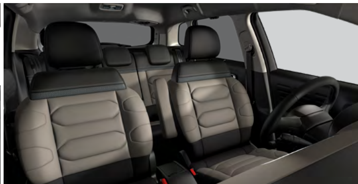
HYPE GREY (1ZFQ)