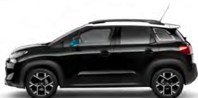
ČIERNÁ PERLA NERA (M)