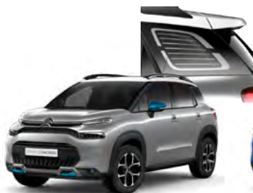
PACK COLOR – MODRÝ