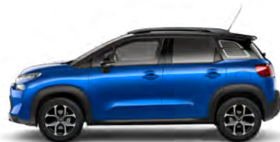
MODRÁ VOLTAIC (M)