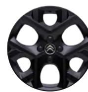
Disk z ľahkej zliatiny ORIGAMI 17" čierny