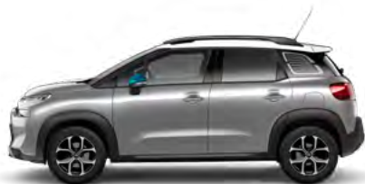
SIVÁ ARTENSE (M)