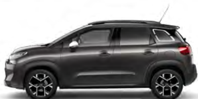
SIVÁ PLATINUM (M)