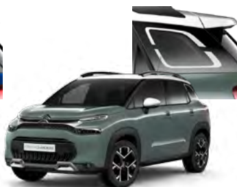
PACK COLOR – BIELY