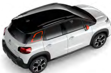
Čierna PERLA NERA