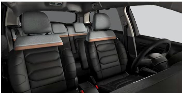
METROPOLITAN GRAPHITE (1QFX)