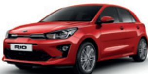
Signal Red (metalický lak)