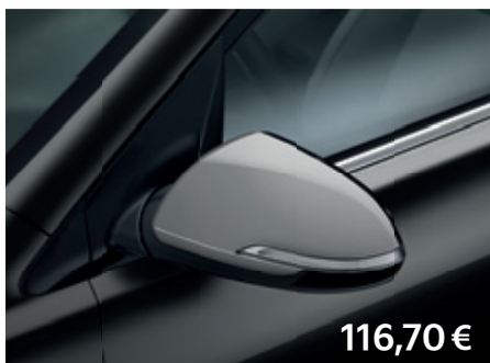
Kryt vonkajších spätných zrkadiel