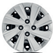
15-palcové ocelové disky kolies s okrasnými plastovými krytmi (pneumatiky 185/65 R15)