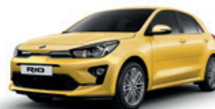
Most Yellow (perleťový lak)