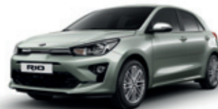
Urban Green (metalický lak)