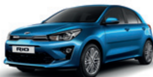
Sporty Blue (metalický lak)