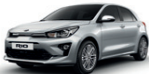
Silky Silver (metalický lak)