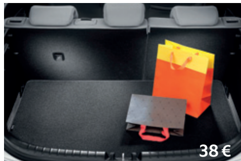
Podložka batožinového priestoru