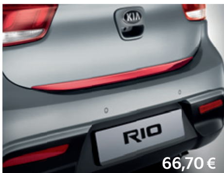
Lišta dverí batožinového priestoru