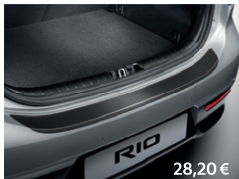
Ochranná fólia zadného nárazníka