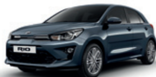
Smoke Blue (metalický lak)