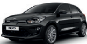
Aurora Black Pearl (perleťový lak)