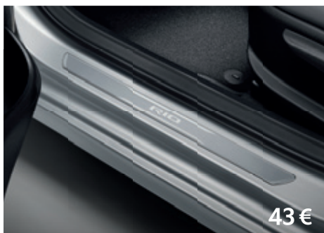
Vstupné ozdobné lišty