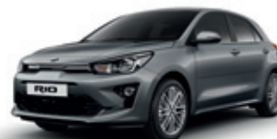
Perennial Grey (metalický lak)