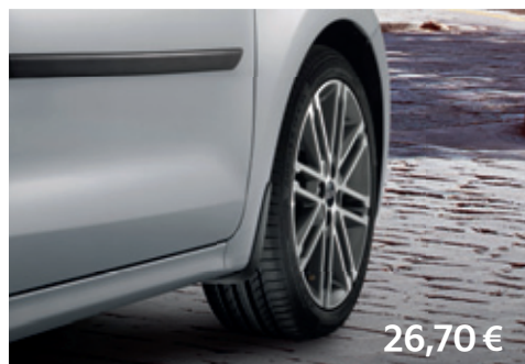
Súprava predných lapačov nečistôt