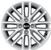
15-palcové disky kolies z ľahkých zliatin (pneumatiky 185/65 R15)