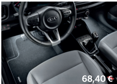
LED osvetlenie priestoru nôh