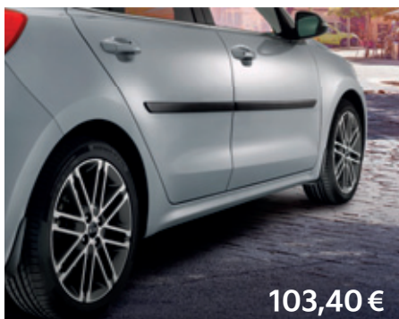
Bočné ozdobné lišty