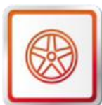
ORIGINÁLNE PRÍSLUŠENSTVO SEAT