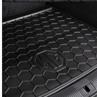
Ochranná vaňa do kufra