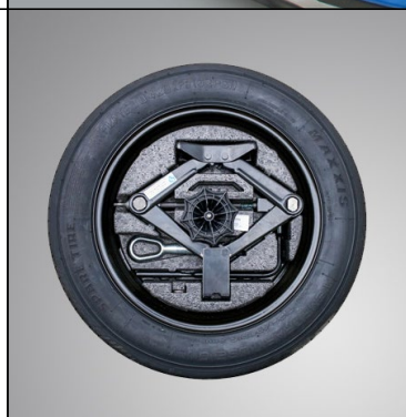
Dojazdové rezervné koleso