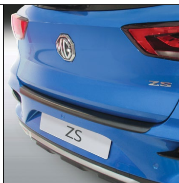
Ochranná lišta zadného nárazníka