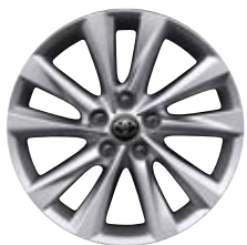
16" zliatinové disky kolies, pneumatiky 205/55 R16 Pre výbavu Comfort