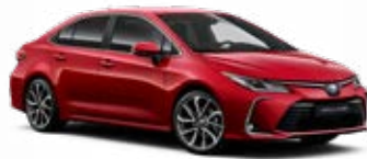
3U5 Červená – karmínová Špeciálny lak 780 €