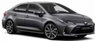
1G3 Sivá – popolavá Metalický lak 520 €