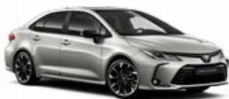
2VF Sivá – Dynamic s čiernou strechou Metalický lak pre GR SPORT bez príplatku