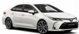
040 Biela – čistá Štandardný lak Bez príplatku