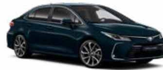
785 Modrozelená – tmavá Metalický lak 520 €