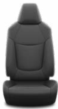
FA20 Čalúnenie textilné čierne Pre výbavu Active