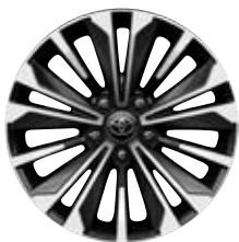
17" zliatinové disky kolies, pneumatiky 225/45 R17 Pre výbavu Style