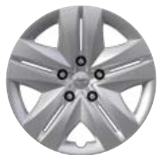
16" oceľové disky kolies s celoplošnými krytmi, pneumatiky 205/55 R16 Pre výbavu Active