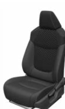
LA21 Čalúnenie textil/ syntetická koža čierne Pre výbavu Executive