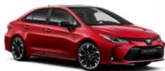
2TB Červená – karmínová s čiernou strechou Špeciálny lak pre GR SPORT 260 €