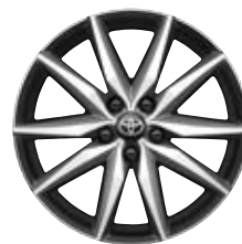
18" zliatinové disky kolies, pneumatiky 225/40 R18 V pakete Dynamic