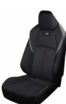
FC20 Čalúnenie textil/ syntetická koža čierno-sivé Pre výbavu GR SPORT