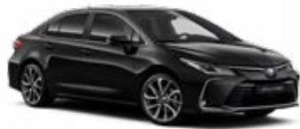
209 Čierna – nočná obloha Metalický lak 520 €