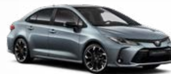
2TH Sivá – celestín s čiernou strechou Metalický lak pre GR SPORT bez príplatku