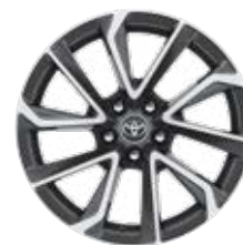
18" zliatinové disky kolies, pneumatiky 225/40 R18 Pre výbavu Executive