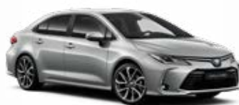
1L0 Strieborná – metalická Metalický lak 520 €