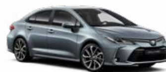
1K3 Sivá – celestín Metalický lak 520 €