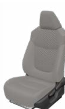
LA10 Čalúnenie textil/ syntetická koža sivé Pre výbavu Executive