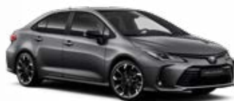
2NB Sivá – popolavá s čiernou strechou Metalický lak pre GR SPORT bez príplatku