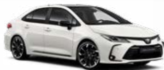
2M2 Biela – čistá s čiernou strechou Štandardný lak pre GR SPORT bez príplatku