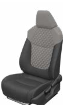
FB10 Čalúnenie textilné sivé Pre výbavu Comfort a Style