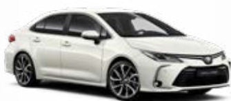
089 Biela – platinová Perleťový lak 780 €