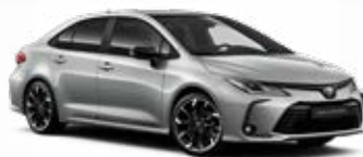
2VU Strieborná – metalická s čiernou strechou Metalický lak pre GR SPORT bez príplatku