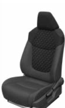
FB21 Čalúnenie textilné čierne Pre výbavu Comfort a Style