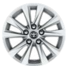
16" zliatinové disky kolies, pneumatiky 205/55 R16