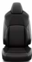
EA21 Čalúnenie textilné/ syntetická koža čierne Pre výbavu Style