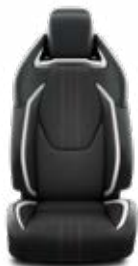
FC21 Čalúnenie textilné/ syntetická koža v dizajne GR SPORT s červeným prešívaním Pre výbavu GR SPORT