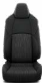
FA20 Látkové čalúnenie Pre výbavu Active