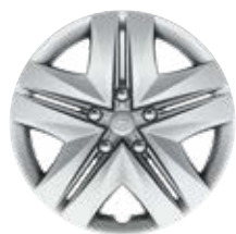
16" ocelové disky kolies s celoplošnými krytmi, pneu 205/55 R16