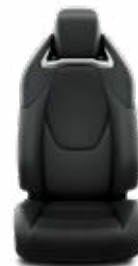
LC20 Čalúnenie syntetická koža čierne Pre výbavu Executive