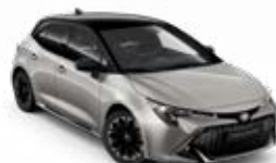
2RD* Strieborná – zamatová so strechou v čiernej farbe 260 €