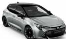
2TX* Strieborná – metalická so strechou v čiernej farbe bez príplatku