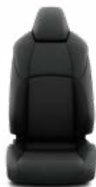
FB21 Látkové čalúnenie Pre výbavu Comfort, paket Tech a Business