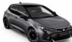
2MB* Sivá – popolavá so strechou v čiernej farbe bez príplatku