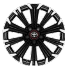
17" zliatinové disky kolies, pneumatiky 225/45 R17