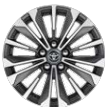
17" zliatinové disky kolies, pneumatiky 225/45 R17