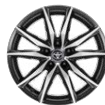
18" zliatinové disky kolies, pneumatiky 225/40 R18