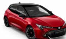
2SZ* Červená – karmínová so strechou v čiernej farbe 260 €