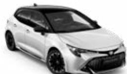
2NR* Biela – čistá so strechou v čiernej farbe bez príplatku