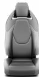
LF20 Čalúnenie syntetická koža svetlé Pre výbavu Executive