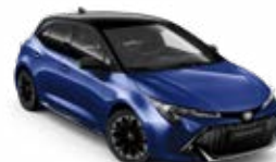
2VL* Modrá – borievková so strechou v čiernej farbe bez príplatku