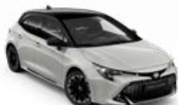
2RZ* Sivá – Dynamic so strechou v čiernej farbe bez príplatku