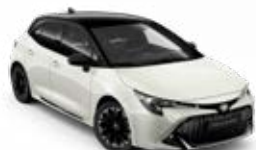
2PU* Biela – platinová so strechou v čiernej farbe 260 €