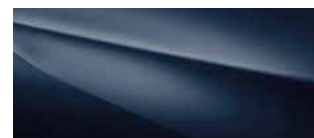
Dark Blue Pearl