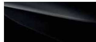
Crystal Black Silica