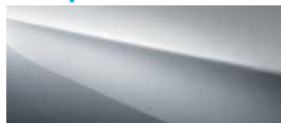
Ice Silver Metallic