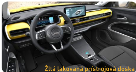
Žltá lakovaná prístrojová doska