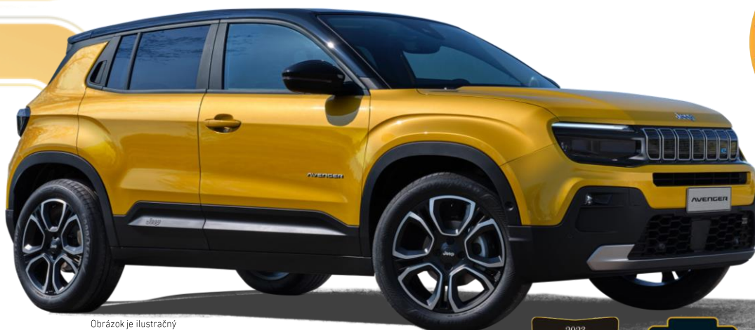
Obrázok je ilustračný