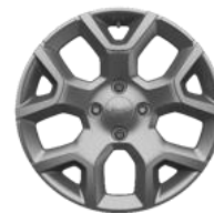
17" disky z ľahkých zliatin matná strieborná Paket TECH & STYLE