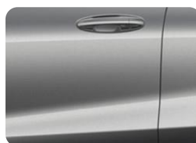
Solar Silver Metalická