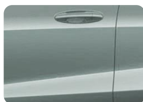
Cactus Gray Nemetalická