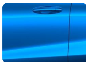
Desert Island blue