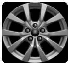
16" Sparkle Silver Titanium séria