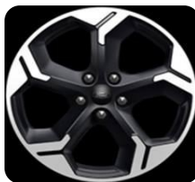
17" Agate black Active séria