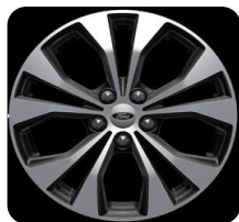
17" Magnetic D2YBV