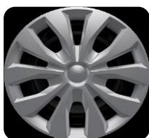
15" oceľové disky s krytmi kolies séria