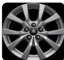
16" Sparkle Silver -zliatinové D2XCH