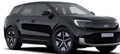
Agate Black metalická