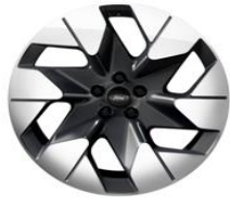
20" zliatinové disky šedá Magnetic Línia výbavy Premium