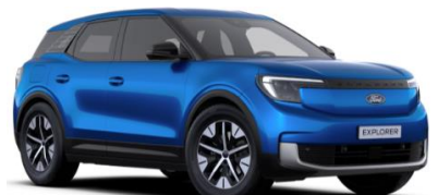
Blue My Mind prémiová metalická