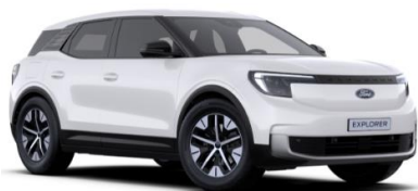
Frozen White nemetalická

● štandardná výbava □ nie je k dispozícii