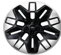
21" zliatinové disky čierna Asphalt Matt Voliteľne