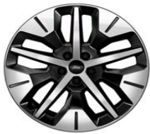
19" zliatinové disky čierna Absolute Línia výbavy Explorer