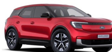
Lucid Red prémiová metalická