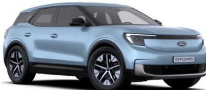
Arctic Blue metalická