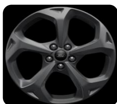
18" x 7.5" sériová výbava pre ST-Line a ST-Line X