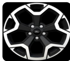
19" x 7.5" sériová výbava pre Active a Active X