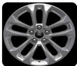
17" x 7.0" sériová výbava pre Titanium