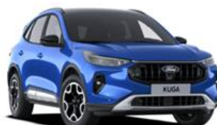
Desert Island blue