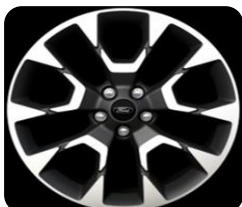
19" x 7.5" voliteľná výbava pre Active a Active X