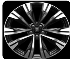
20" x 8.0" voliteľná výbava pre ST-Line X a Active X