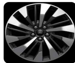
18" x 7.5" voliteľná výbava pre Titanium