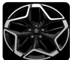
19" x 7.5" voliteľná výbava pre ST-Line a ST-Line X