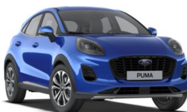
Desert Island Blue metalická