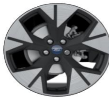
18" disky z ľahkej zliatiny Štandardná výbava pre ST-Line X