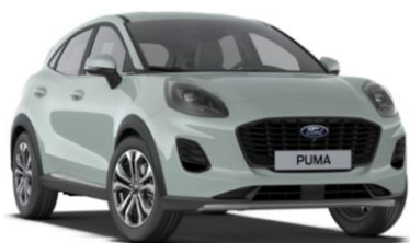
Cactus Gray nemetalická

● štandardná výbava - nie je k dispozícii □ dostupné v pakete