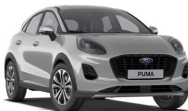
Solar Silver metalická