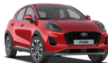
Fantastic Red metalická