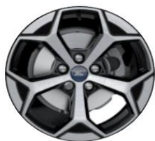
17" disky z ľahkej zliatiny ST-Line, s povrchovou úpravou Štandardná výbava pre ST-Line