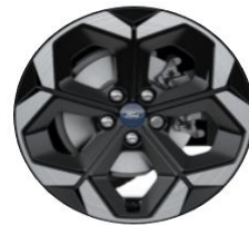
19" disky z ľahkej zliatiny Voliteľná výbava ST-Line a ST-Line X