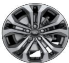
17" disky z ľahkej zliatiny, čierne s povrchovou úpravou Štandardná výbava Titanium