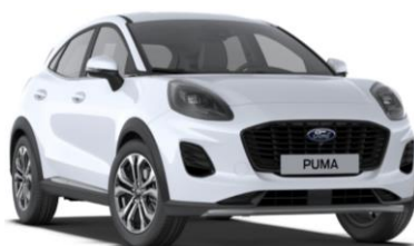
Frozen White nemetalická