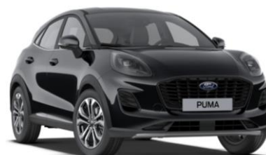
Agate Black metalická