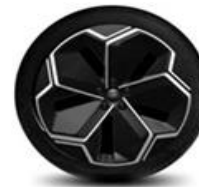
21" zliatinové disky čierna Asphalt Matt Voliteľne D2GCX