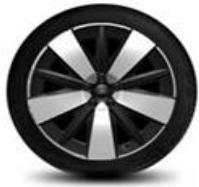
19" zliatinové disky čierna Absolute Línia výbavy Capri