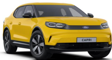
Vivid Yellow nemetalická