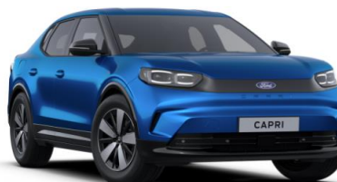
Blue My Mind prémiová metalická