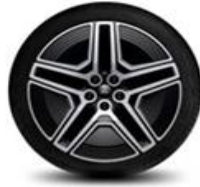
20" zliatinové disky šedá Magnetic Línia výbavy Premium