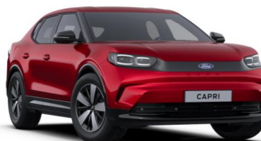
Lucid Red prémiová metalická