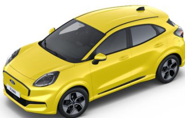
Electric Yellow metalická