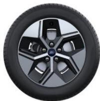
17" disky z ľahkej zliatiny Štandardná výbava Puma Gen-E