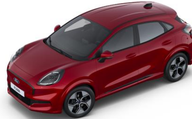
Fantastic Red metalická