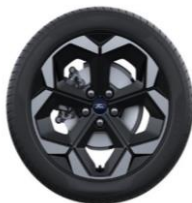
18" disky z ľahkej zliatiny Štandardná výbava Puma Premium