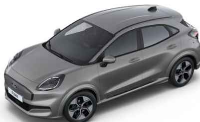
Solar Silver metalická