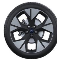
19" disky z ľahkej zliatiny Voliteľná výbava D2VCA