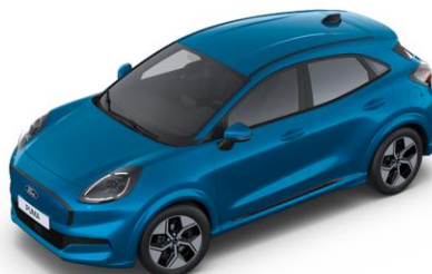
Digital Aqua Blue metalická