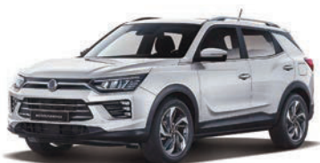
GRAND biela (WAA)