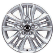
17" ALU disky, pneumatiky 225/60 R17