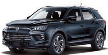
SPACE čierna (LAK)