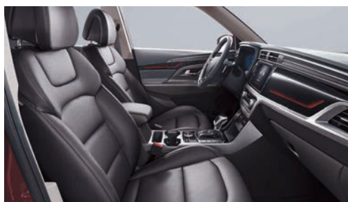
Čierna interiér (LBH)