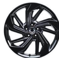
19" čierne ALU disky „Diamond Cutting“, pneumatiky 235/50 R19