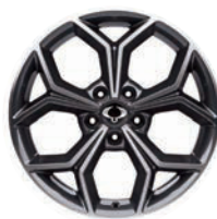
18" ALU disky „Diamond Cutting“, pneumatiky 235/55 R18