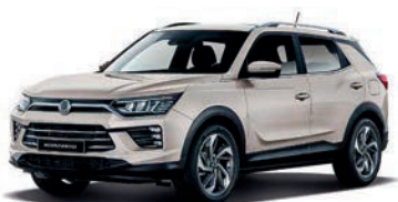
LATTE béžová (EBL)