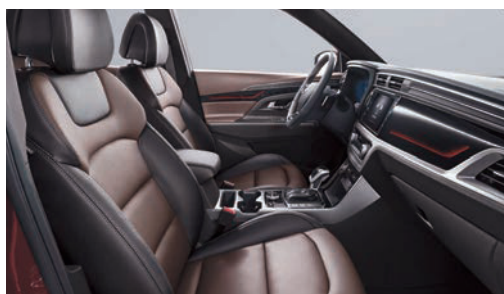
Hnedý kožený paket (OAY)