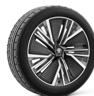
Neptune Antracitové s aero krytom