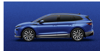
Modrá Race, metalická