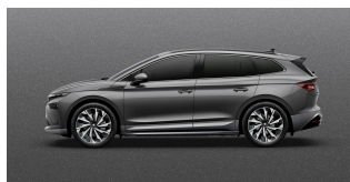
Sívá Graphite, metalická