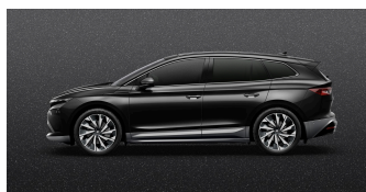
Čierna Magic, metalická