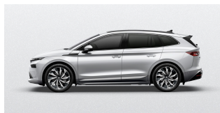
Biela Moon, metalická