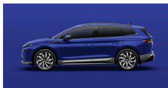
Energy Blue, uni