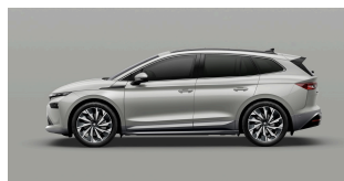
Sívá Steel, uni