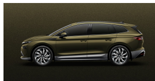
Zelená Olibo, metalická