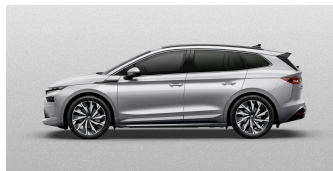
Strieborná Brilliant, metalická