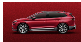
Červená Velvet, metalická