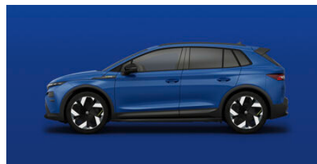
Modrá Energy, uni