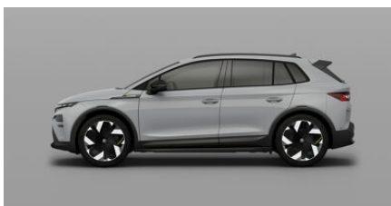
Sivá Steel, uni