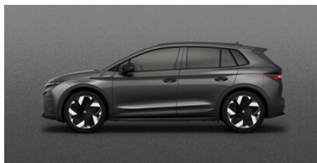
Sivá Graphite, metalická