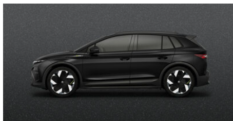
Čierna Magic, metalická