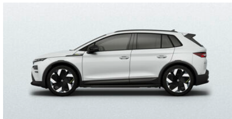
Biela Moon, metalická