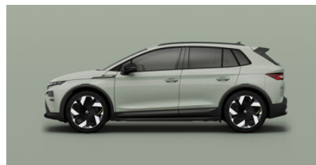
Zelená Timiano, uni