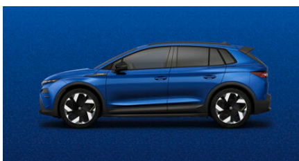
Modrá Race, metalická