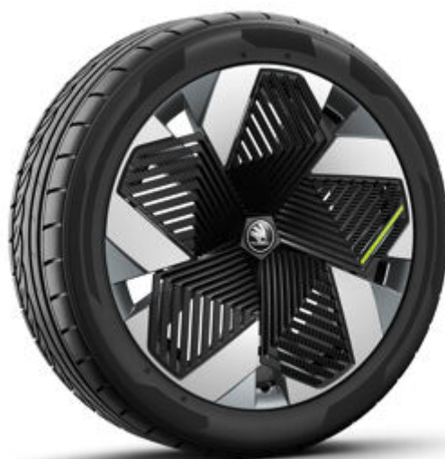
Vision 21" antracitové