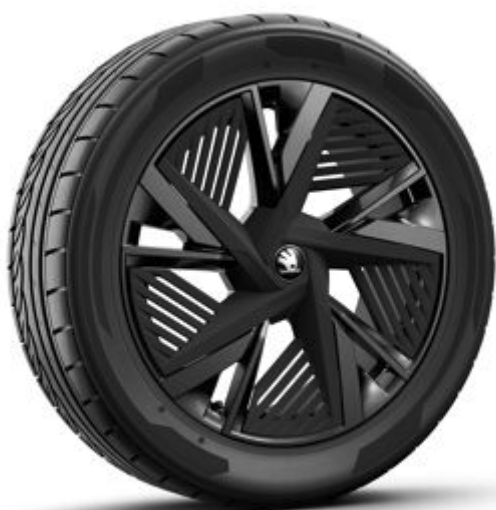
Draconis 20" čierne