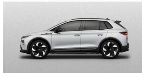
Strieborná Brilliant, metalická