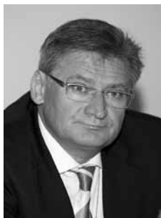
Prof. dr hab. n. med. Bolesław Samoliński 1

BOTTOM-UP strategy for allergy diagnosis during the epidemic threat by SARS-CoV-2 virus causing COVID-19 disease