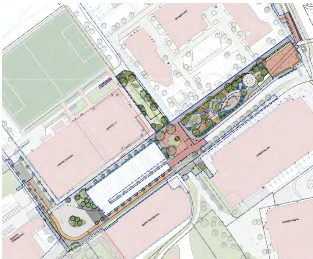
Figur 1: Omfang av prosjektet. Avgrensninger er vist med blå stiplet linje.

Omfanget av prosjektet er vist i skissen nedenfor: