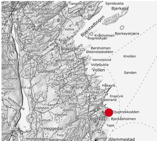
Illustrasjon 1: Oversiktskart, planområdet markert i rødt