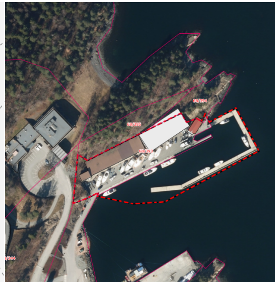
Illustrasjon 2: Planområdet markert, med flyfoto over området