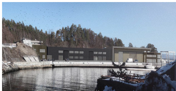
Foreslått ny bebyggelse

Båthavnen/bølgebryteren som er etablert for å etablere trygge arbeidsforhold for virksomheten, videreføres i endret formål (Småbåthavn) som medfører at dispensasjonen fra dagens formål ikke lenger er relevant.