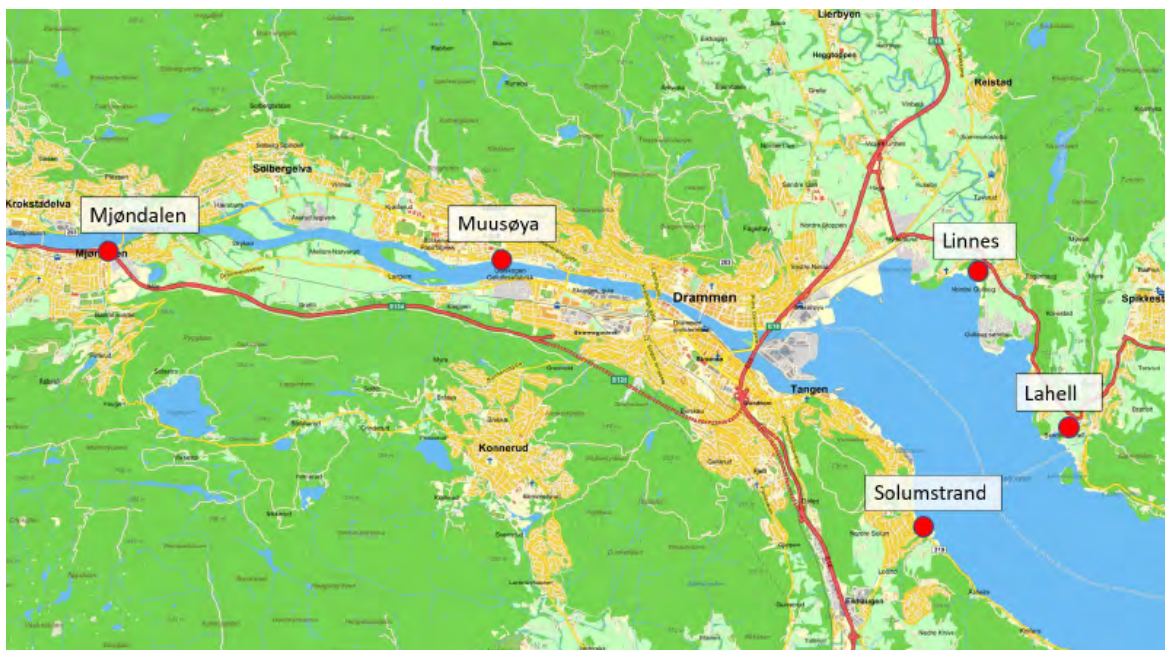
Figur 2 Viser plassering av dagens renseanlegg i Drammensregionen

For alternativ C har Drammen kommune gjennomført en konseptvalgsutredning (KVU) i samarbeid med Asker kommune og Lier kommune. I denne KVU-en inngår også alternativ B som et sammenligningsgrunnlag.