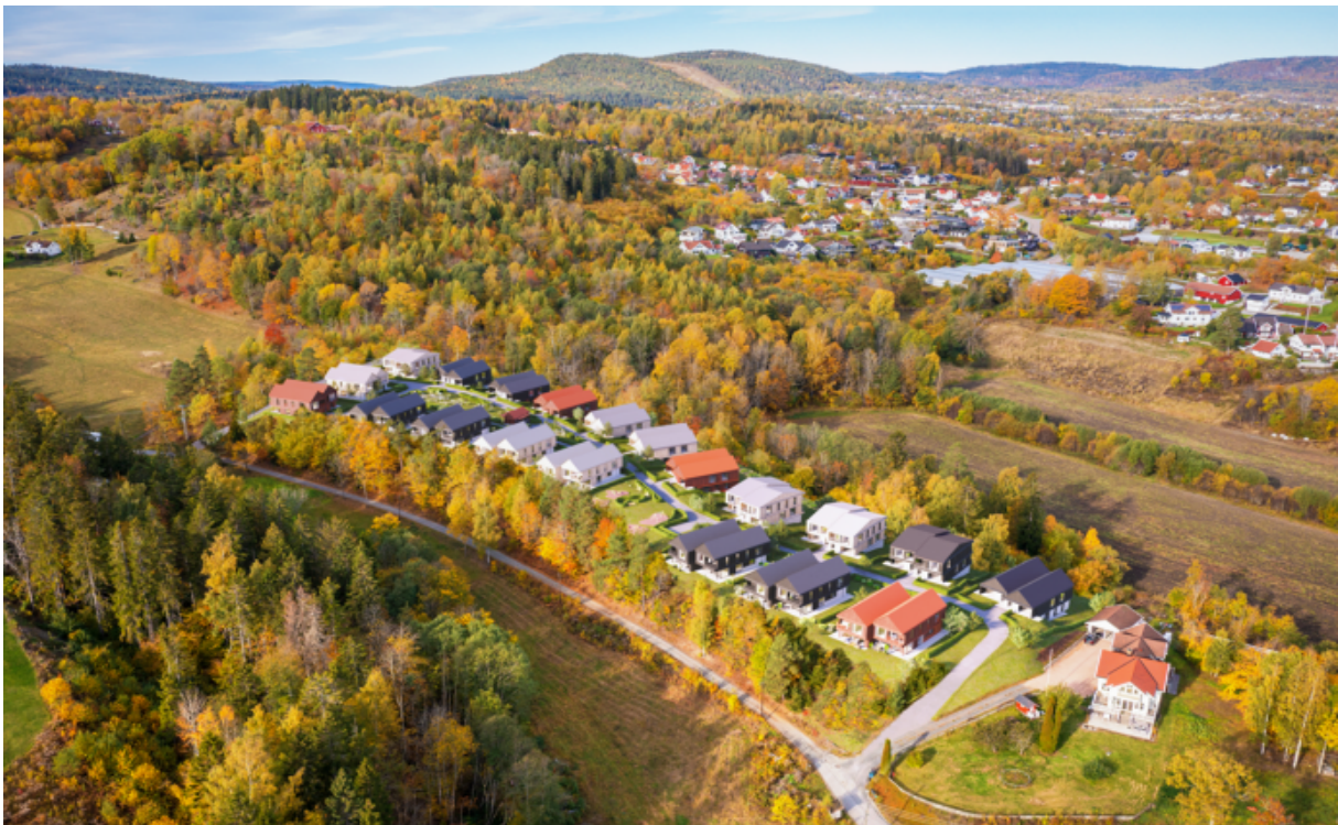
Figur 1 Illustrasjon sett fra syd (Skapa)

Det vises til forslagsstillers planbeskrivelse for mer detaljer.