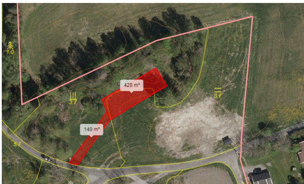
Figur 3. Kommunedirektørens opptegning i gårdskart (NIBIO)

Kommunedirektøren anser derfor at arealet har en verdi for landbruket. Det er heller ikke heldig med fragmentering av jordbruksareal, da det er større sjanse for at restarealet faller ut av drift.