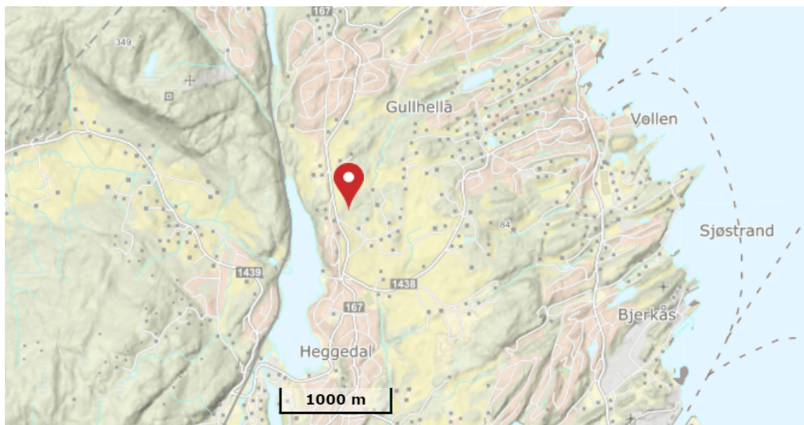
Figur 1. Utsnitt av oversiktskart over eiendommen 76/1 (Askerkart)

Søknaden behandles parallelt etter plan- og bygningsloven.