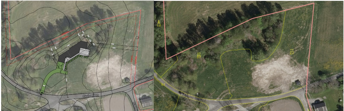
Figur 2. Søkers situasjonsplan (t.v.) og utsnitt fra gårdskart (t.h.) (NIBIO)

Søker begrunner behovet for kårbolig i tilleggsbrev til søknaden datert 28. mars 2023. Det skal foregå et generasjonsskifte, og søker er inne i en fase med reetablering av egen gårdsdrift. I tilleggsbrevet står det at etablering av virksomhetene nedenfor vil kreve arbeidsinnsats og kapital, at kårfolk (i kårbolig) i arbeidsdyktig alder vil være en meget viktig ressurs og en forutsetning for å få dette i gang. Videre står det at kårfolk i kårbolig vil gjøre «kjøpet» av gården betydelig billigere for neste generasjon, og gjøre de i stand til ytterligere investeringer i gården.