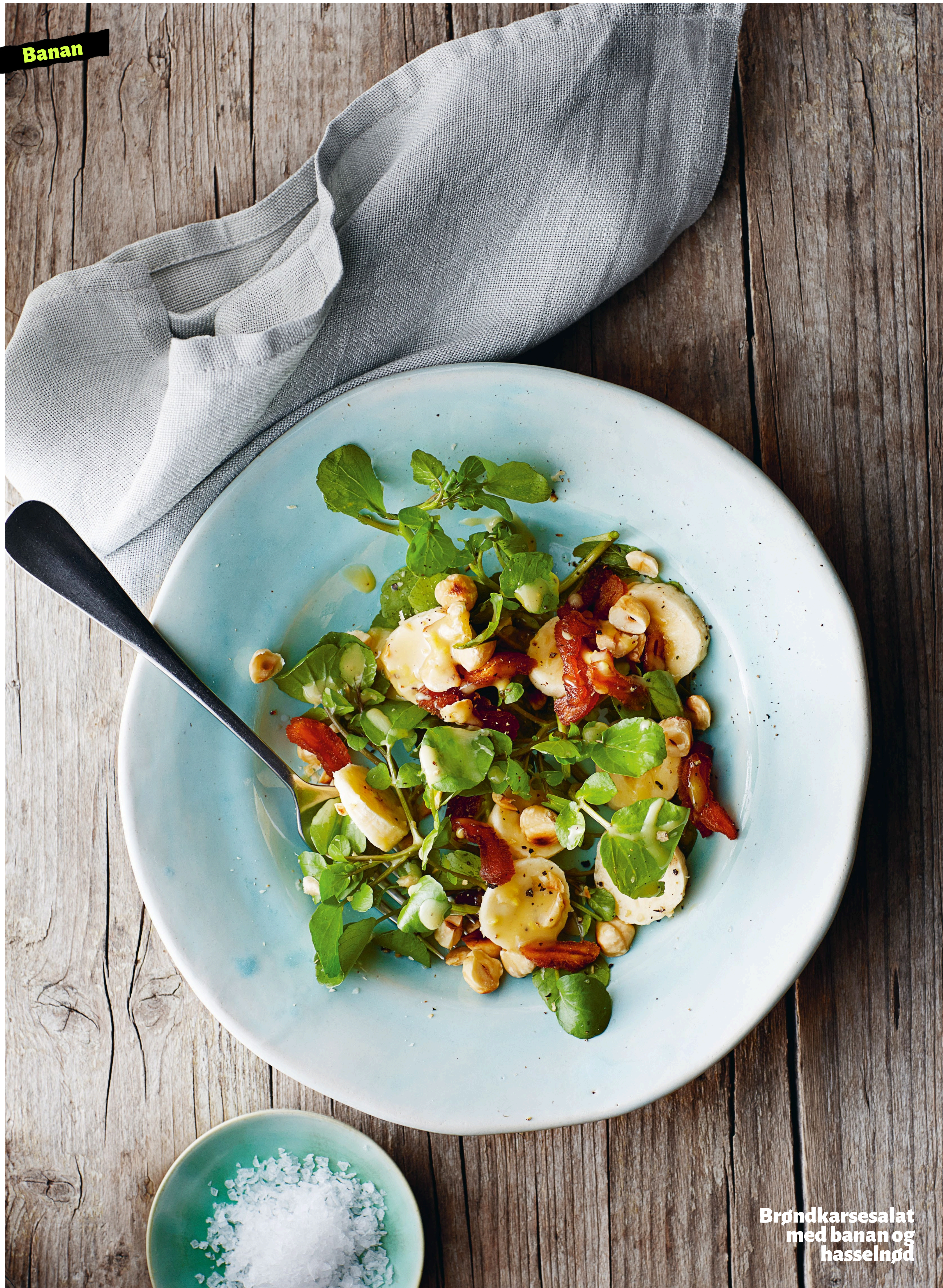
Brøndkarsesalat med banan og hassel nød