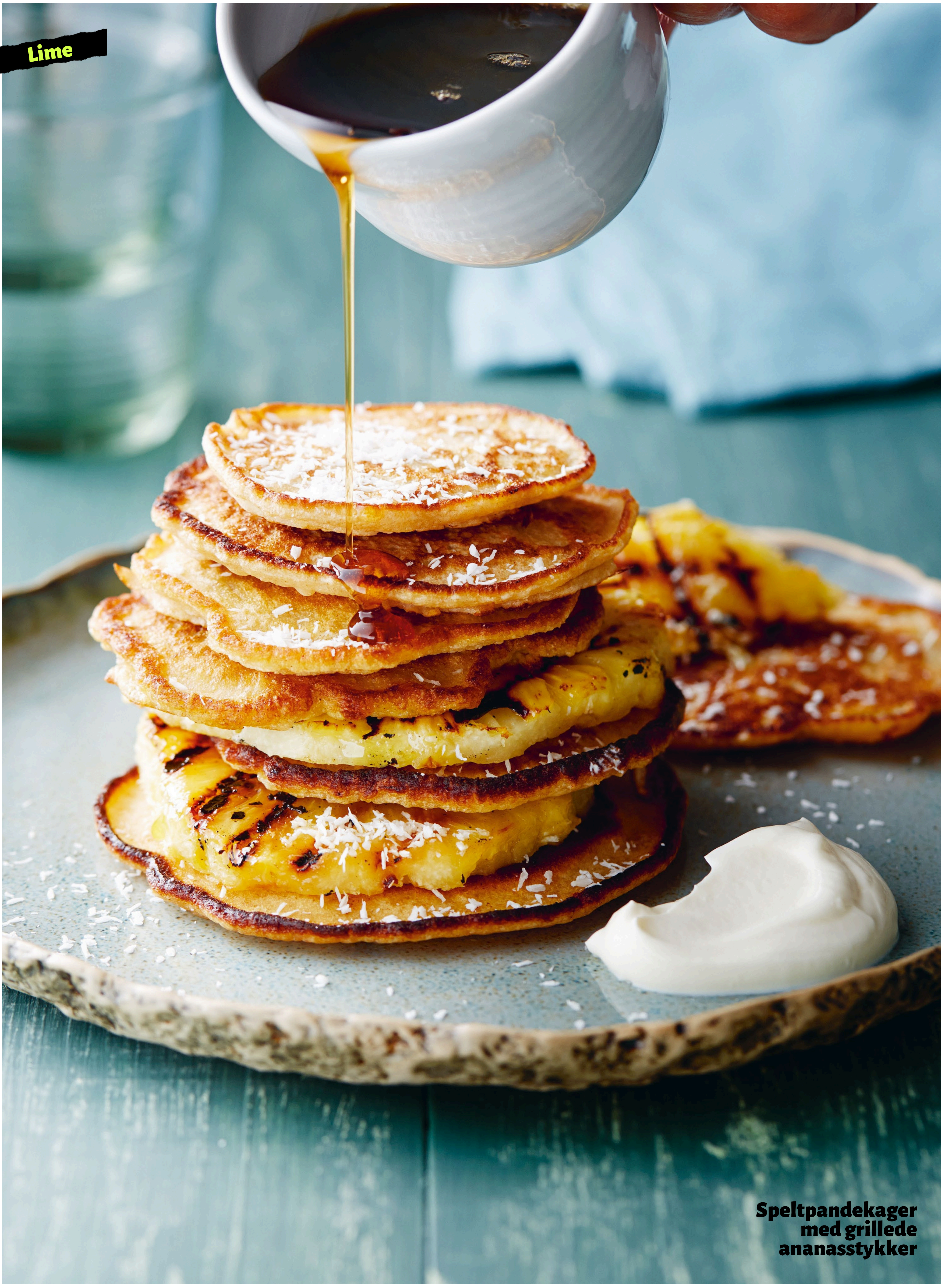
Speltpandekager med grillede ananasstykker