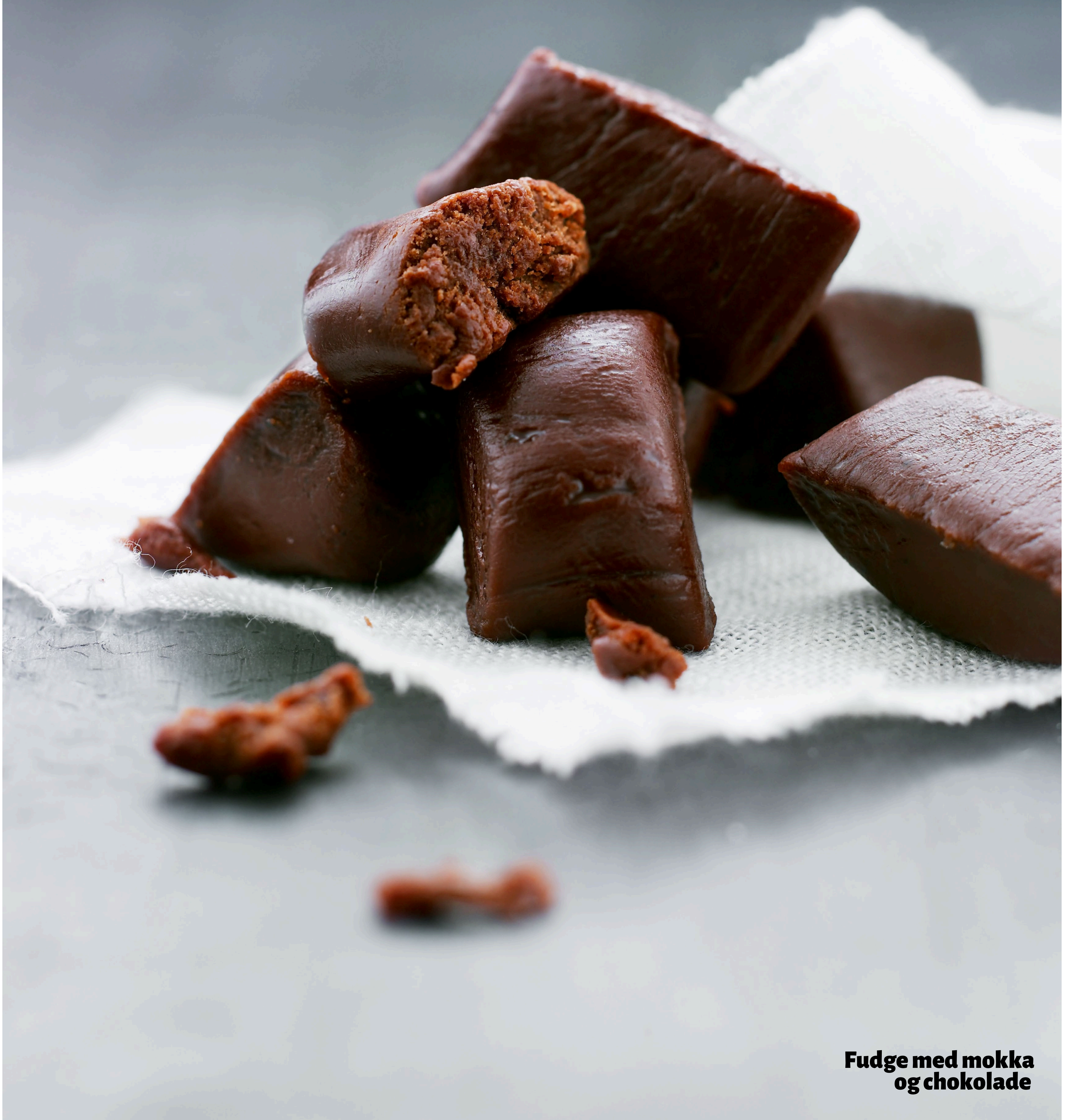
Fudge med mokka og chokolade