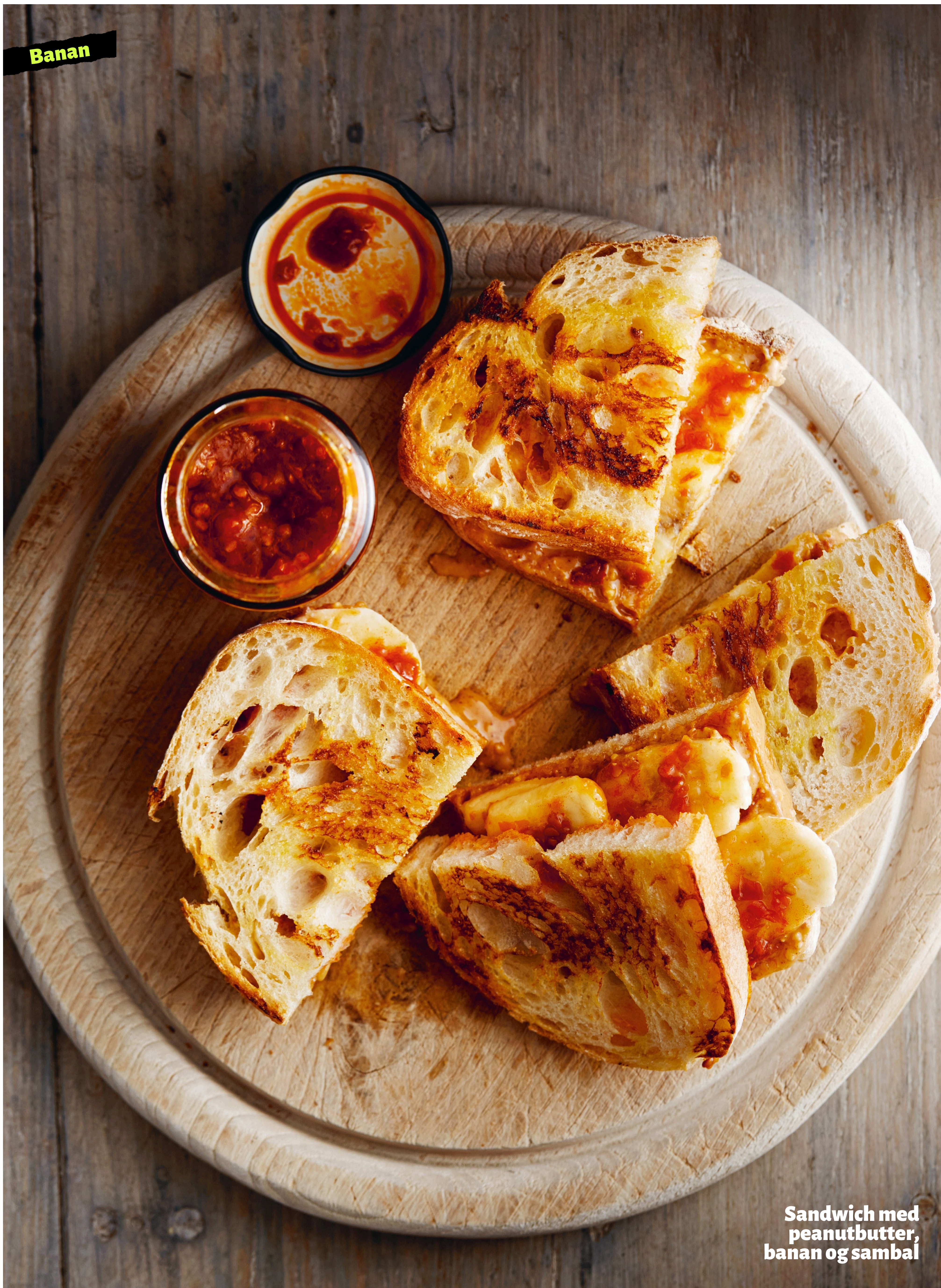
Sandwich med peanutbutter, banan og sambal