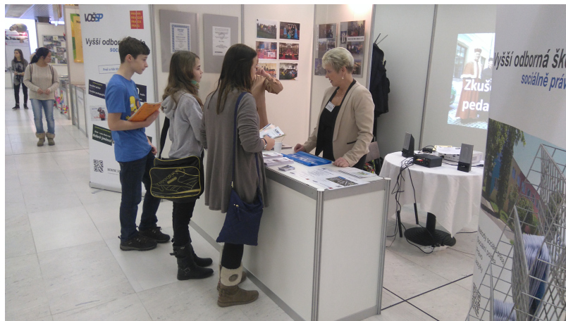
Schola Pragensis 2015

Ve školním roce 2015/2016 se škola prezentovala na výstavě škol SCHOLA PRAGENSIS a zorganizovala v průběhu roku dva Dny otevřených dveří s cílem představit se zájemcům o studium a dodat jim základní potřebné informace ke studiu na škole.