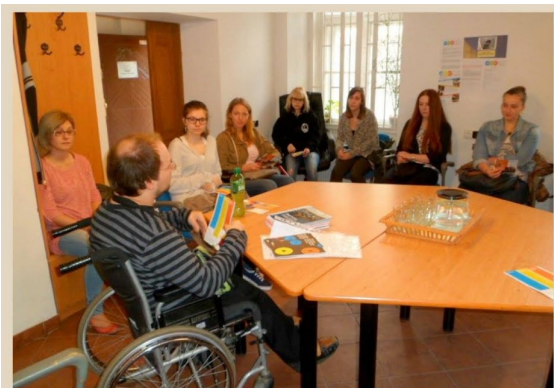
Středisko přístupného vzdělávání Pražské organizace vozíčkářů