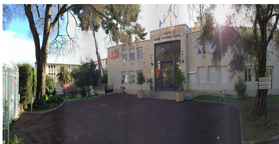
Lycée d'Estienne d'Orves