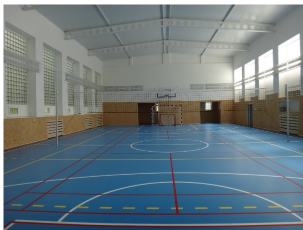
Objekt H - tělocvična