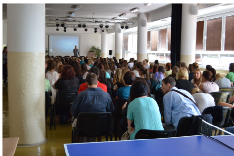
Předávání informací v aule školy

Hlavní cíle seznamovacího kurzu byly splněny. Došlo k seznámení studentů jednotlivých třídních kolektivů, k seznámení účastníků kurzu s vedením a pedagogy školy. Zároveň byli studenti informováni o základních procesech studia na VOŠSP.