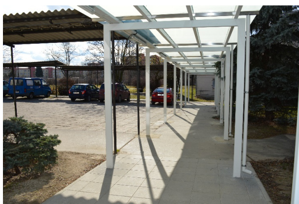
Objekt A - koridor