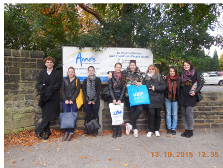
Návštěva St. Anne's Community Services Svatá Anna (komunitní služby)