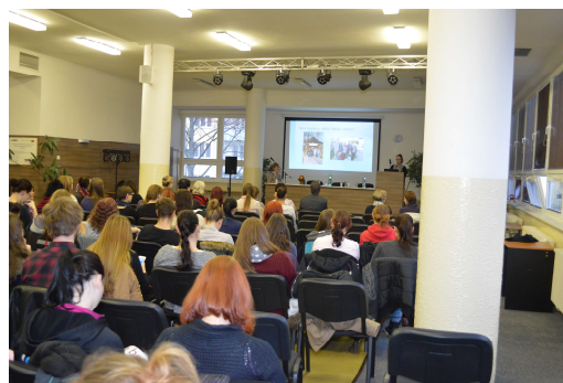
Studentská konference ze zahraničních stáží 12/2015