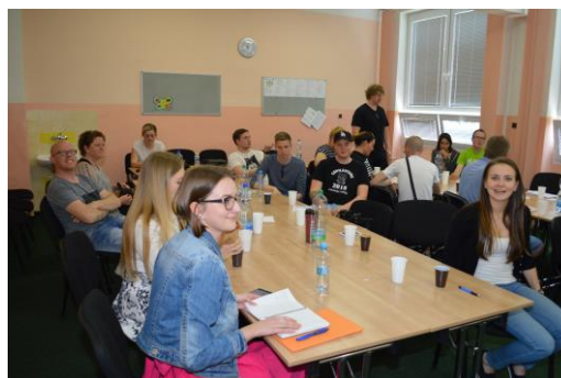
Dopolední setkání ve škole