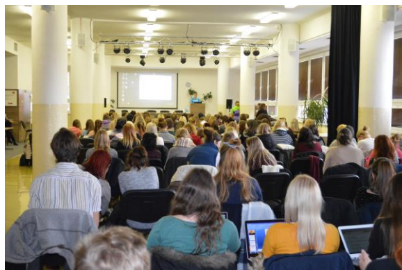
Studentská konference ze zahraničních stáží 12/2016