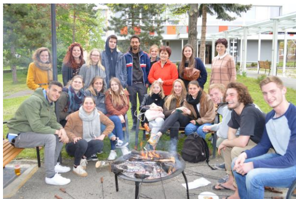
Závěrečné neformální posezení