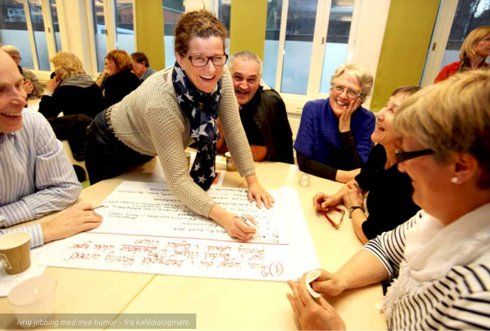
Ivrig jobbing med mye humor - fra kafédialogmøte.