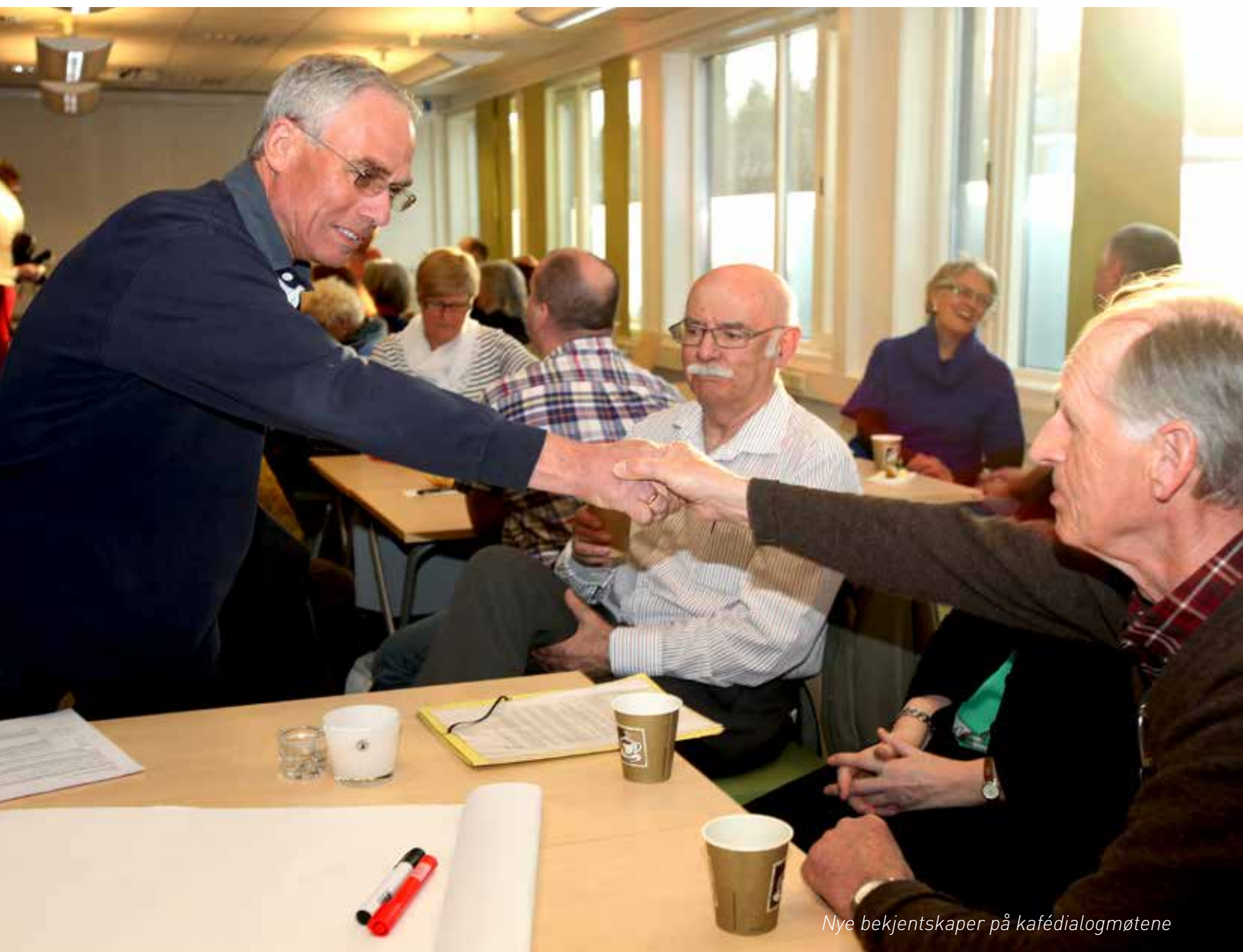
Nye bekjentskaper på kafédialogmøtene

Kilde: Sluttrapporten Frivillighet i Norge, 2013