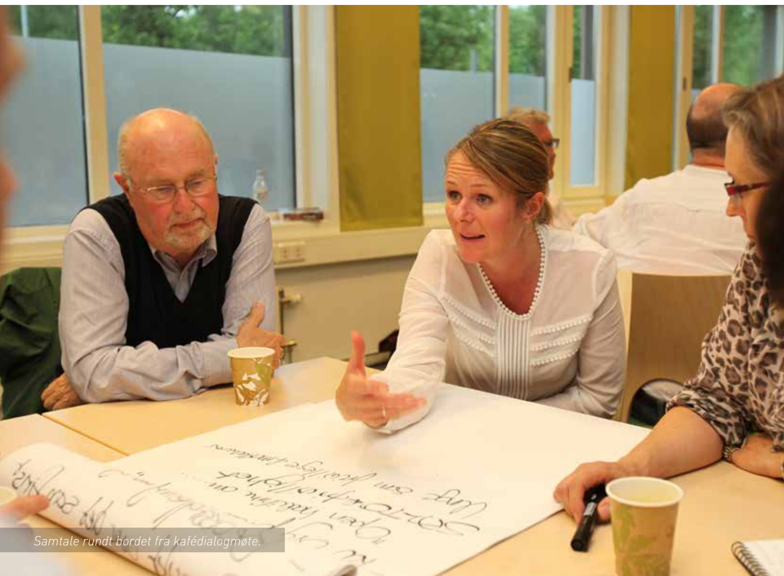
Samtale rundt bordet fra kafédialogmøte.