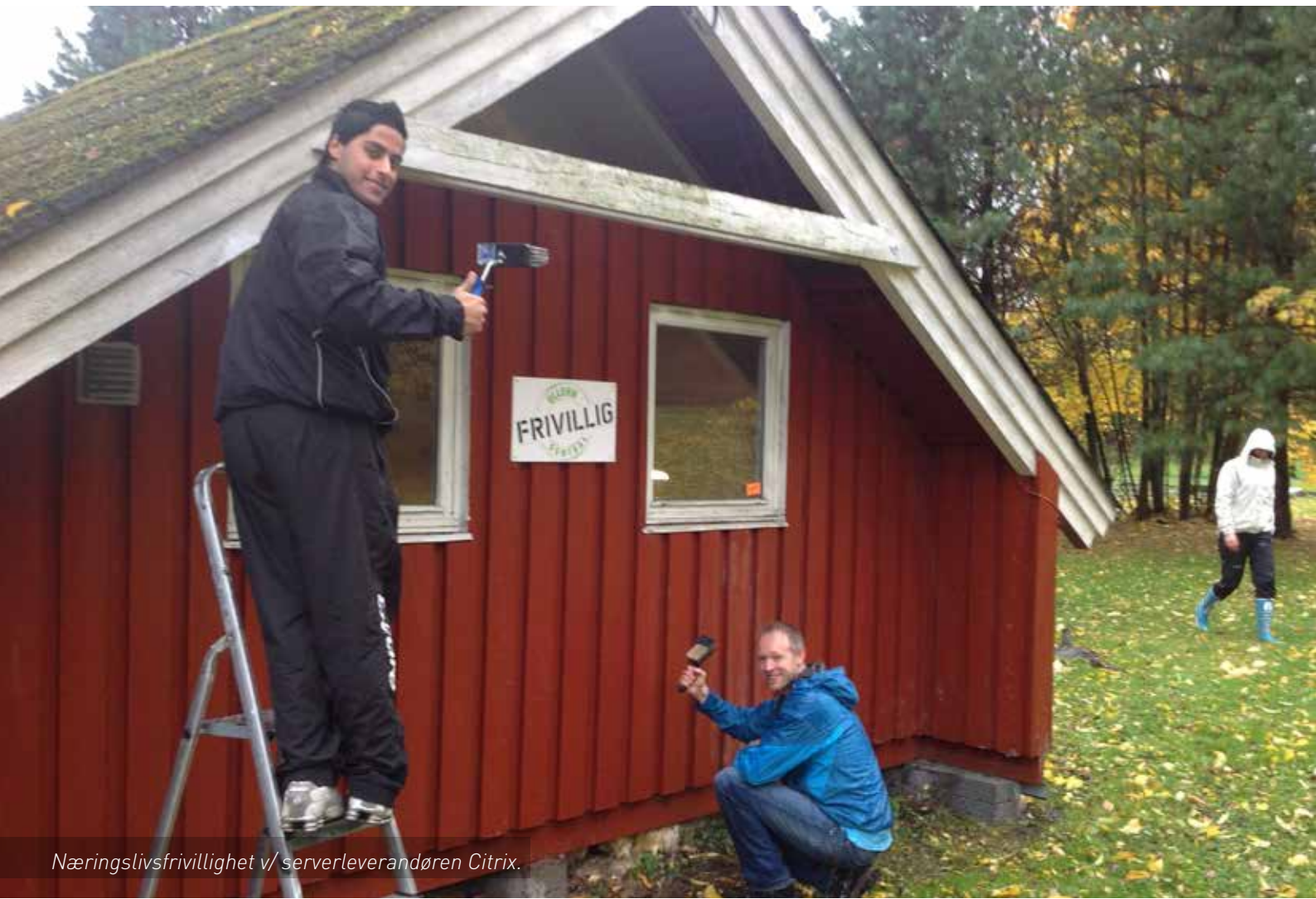
Næringslivsfrivillighet v/ serverleverandøren Citrix.