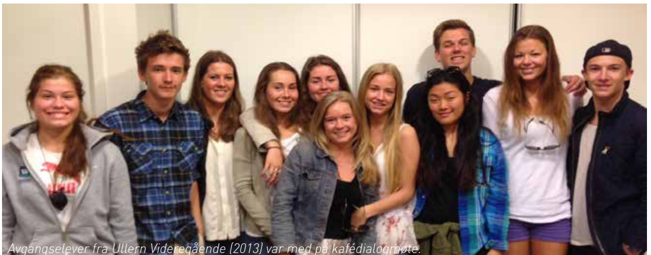
Avgangselever fra Ullern Videregående (2013) var med på kafédialogmøte.

Ungdom i bydelen vil involveres og de har mange idéer til hva de kunne tenke seg å gjøre, - med litt hjelp fra bydelen og frivillige lag og foreninger.