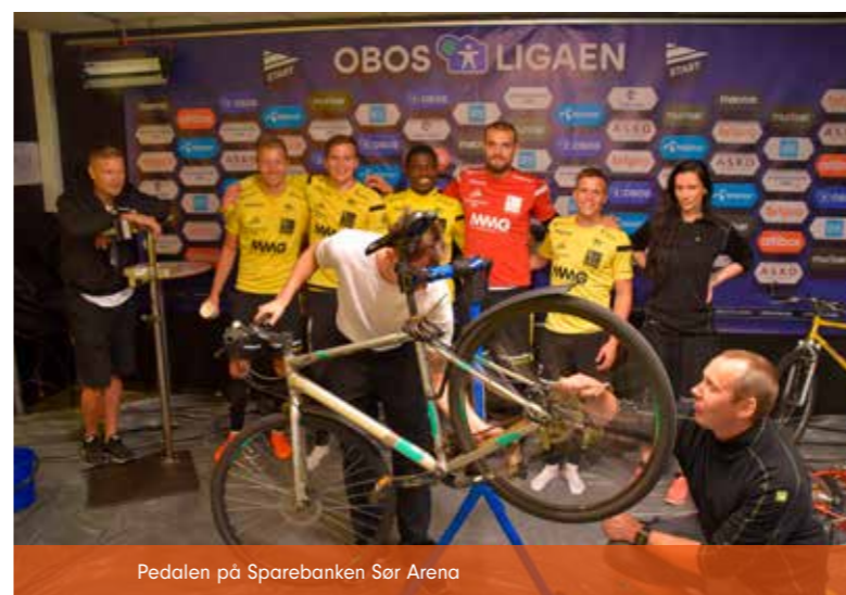
Pedalen på Sparebanken Sør Arena