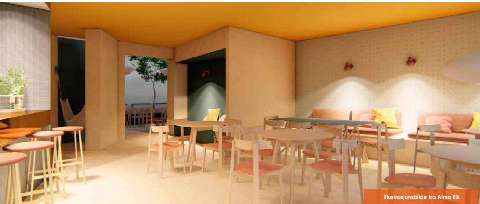
Illustrasjonsbilde fra Alma Eik