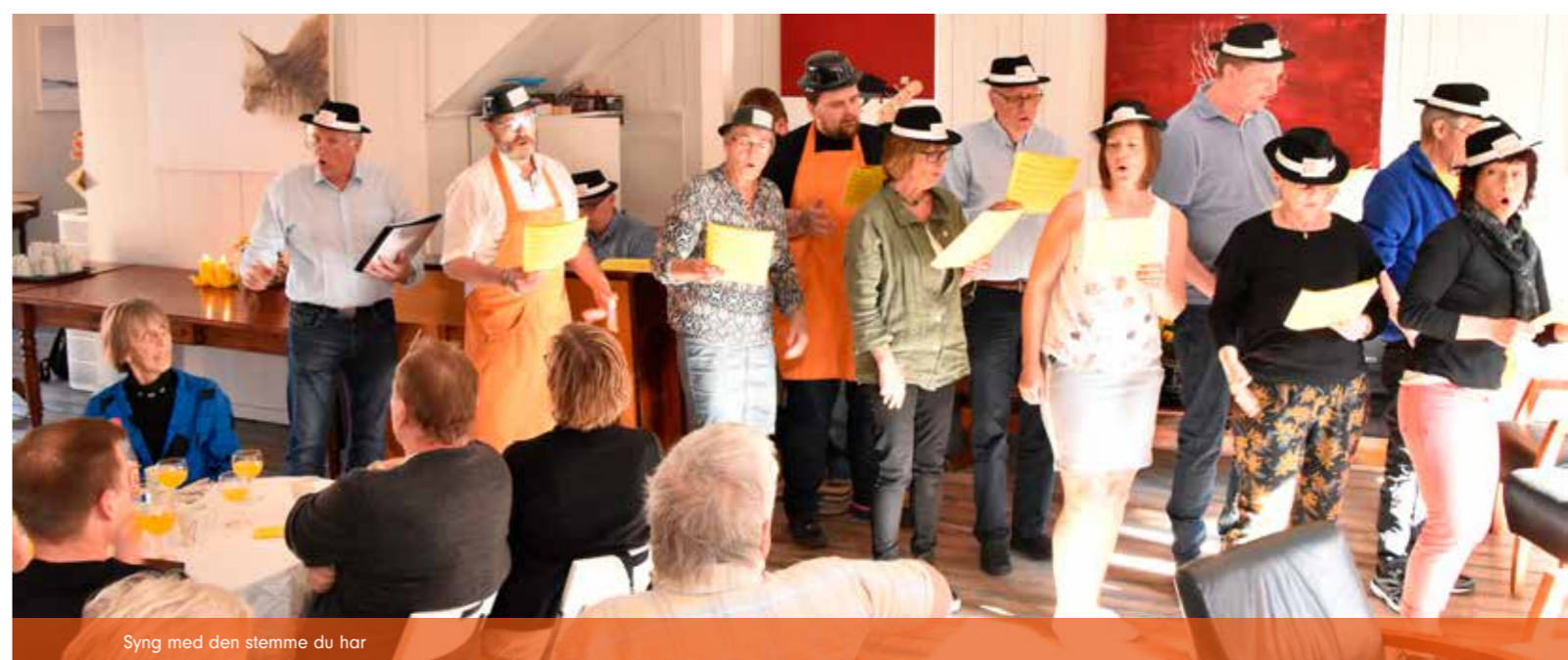
Syng med den stemme du har