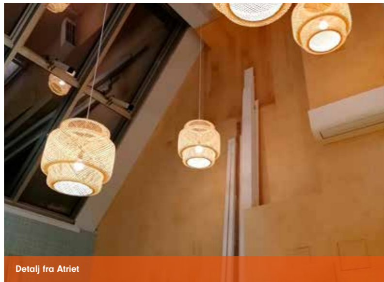
Detalj fra Atriet