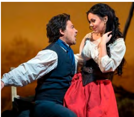
Onsdag 04.11, kl. 12.00: Minioperaen «Elskhovsdrikken».

Alle arrangement er med forbehold om eventuelle endringer i retningslinjer fra FHI.