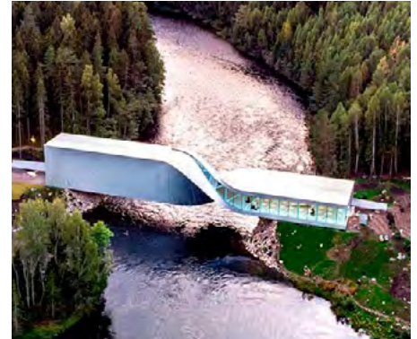
Fredag 11.09, kl. 10.00: Tur til Kistefoss.