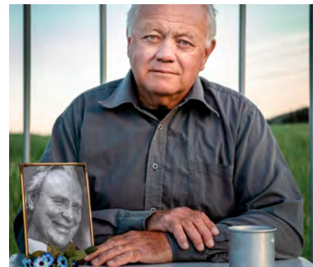
Onsdag 09.12, kl. 12.00: Forestillingen «Forbryter uten brekkjern».