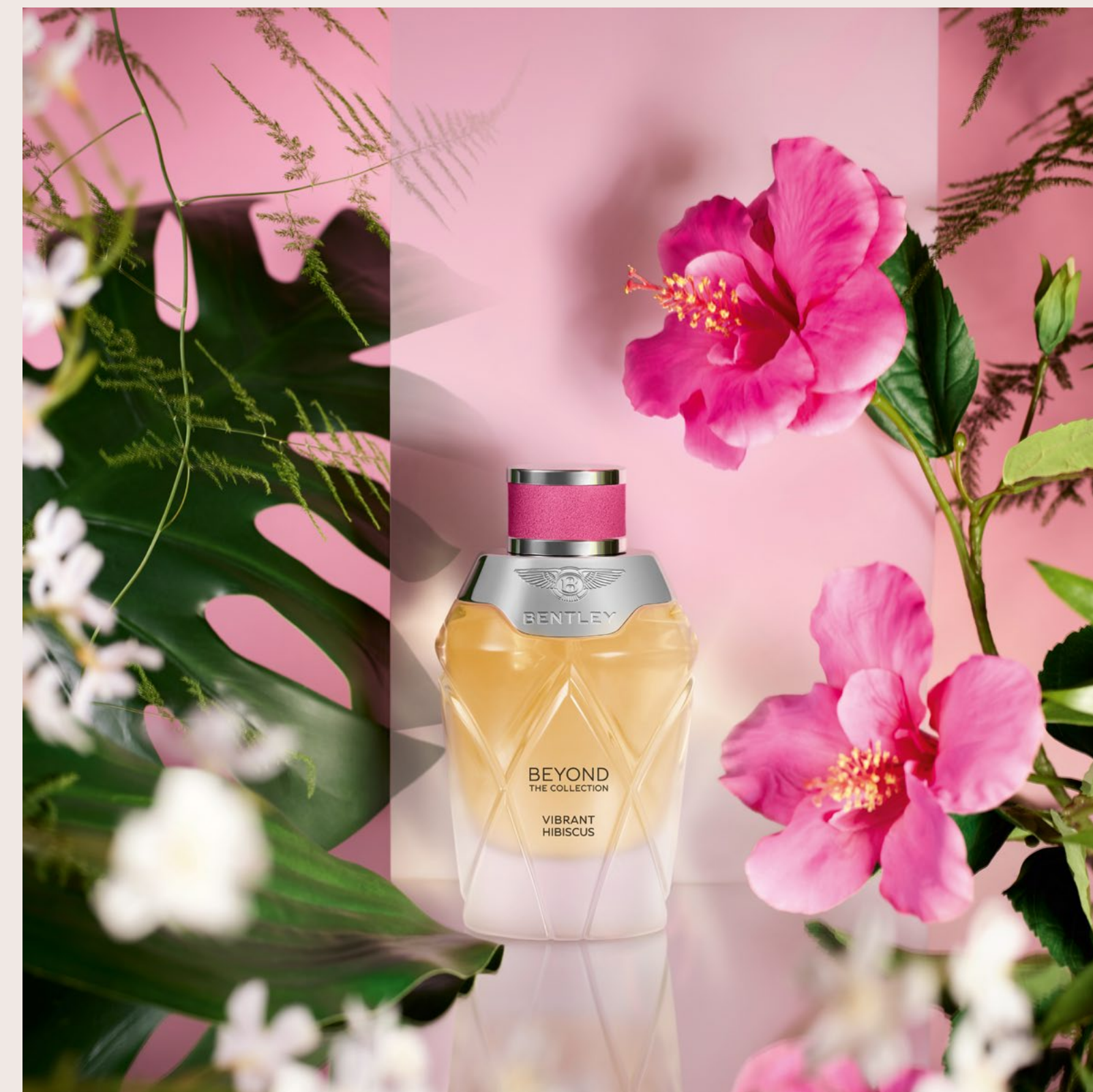
Una odisea a Seúl, Corea del Sur, con Vibrant Hibiscus , un aroma floral.