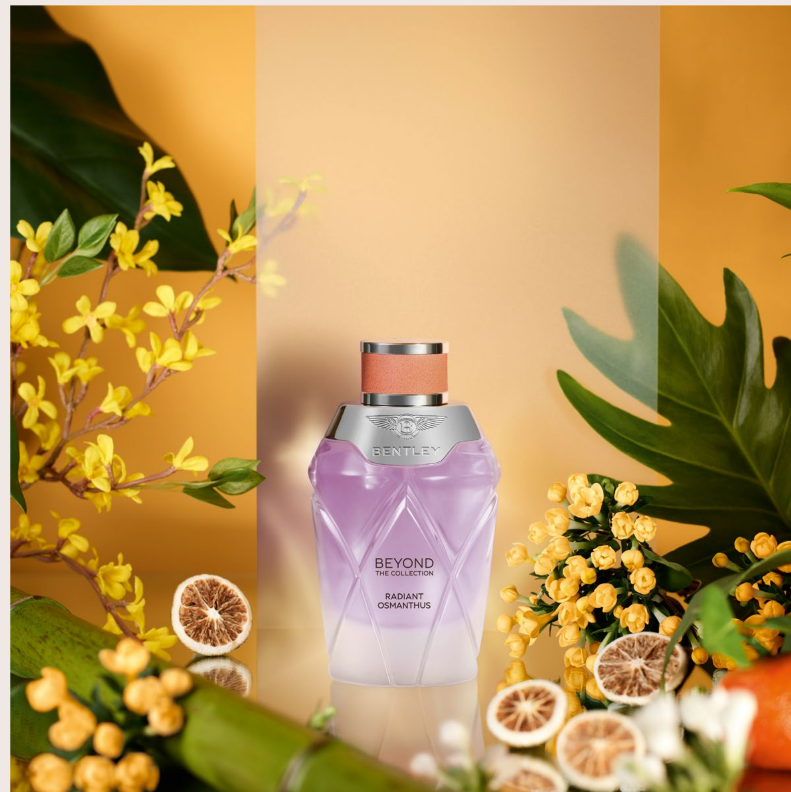
Una escapada a Kioto, Japón, con Radiant Osmanthus , una fragancia floral afrutada.