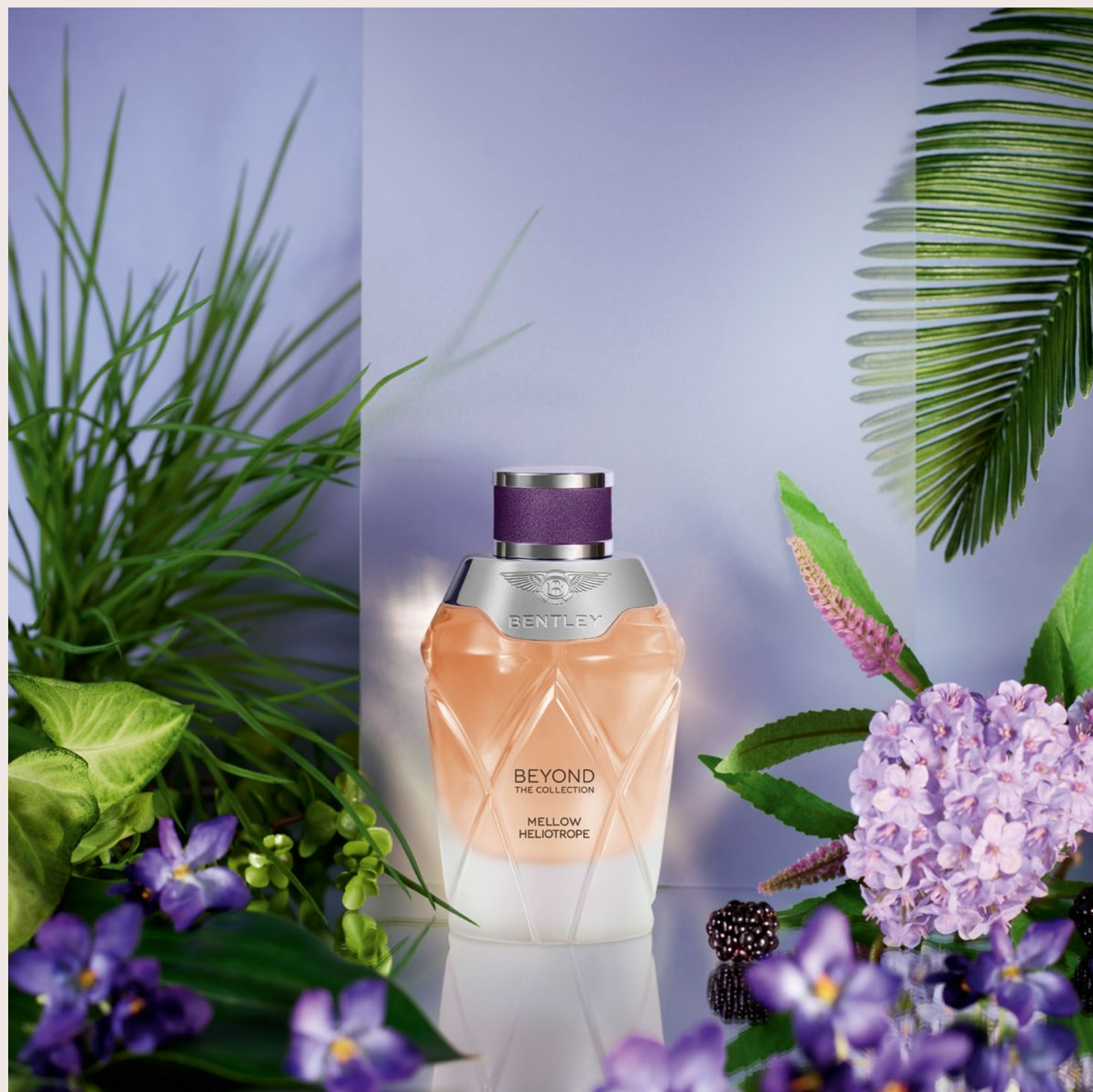
Un viaje a Lima, Perú, con Mellow Heliotrope , una composición floral oriental.