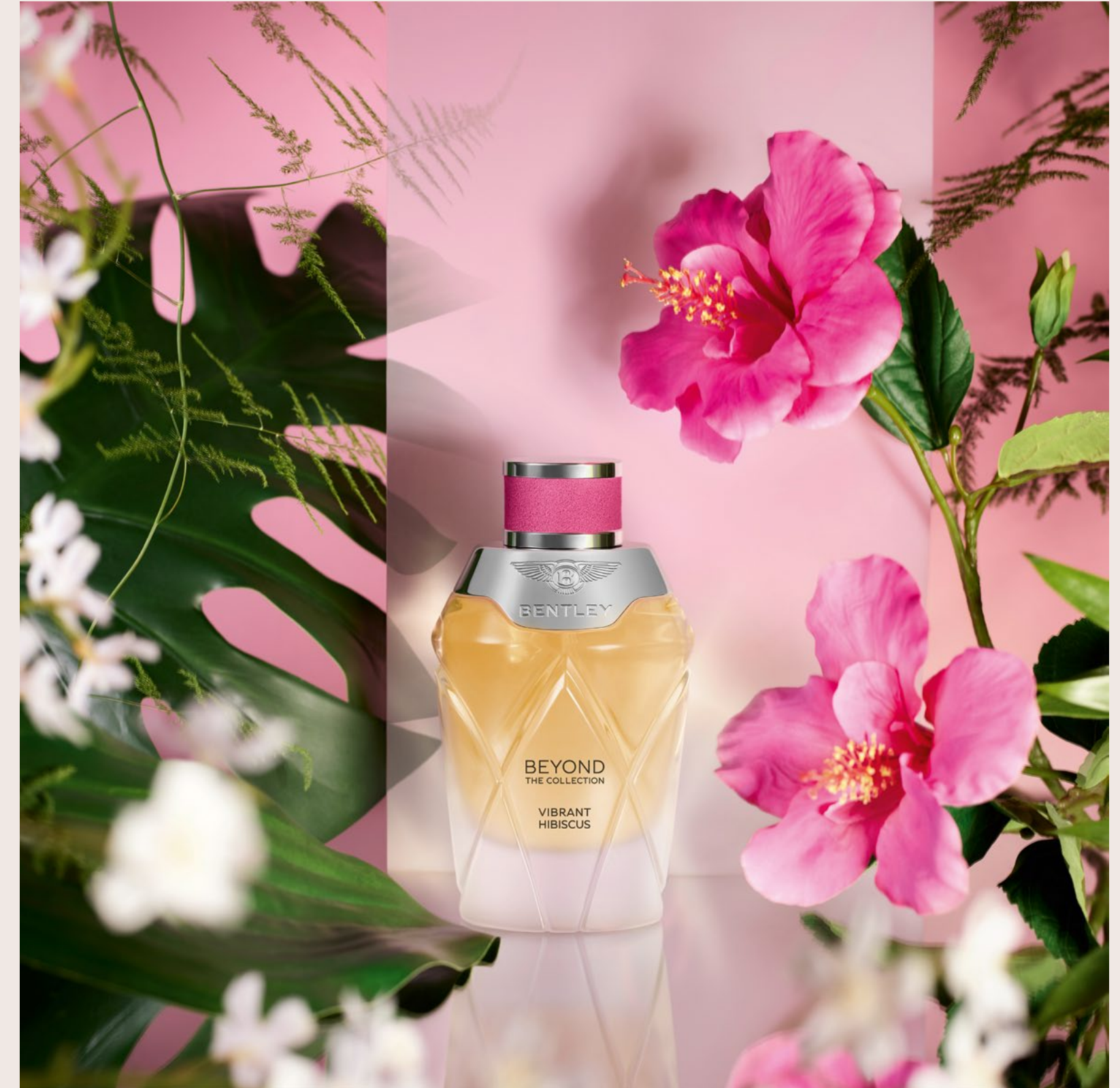
Une odysée à Séoul, en Corée du Sud avec Vibrant Hibiscus , un parfum floral.