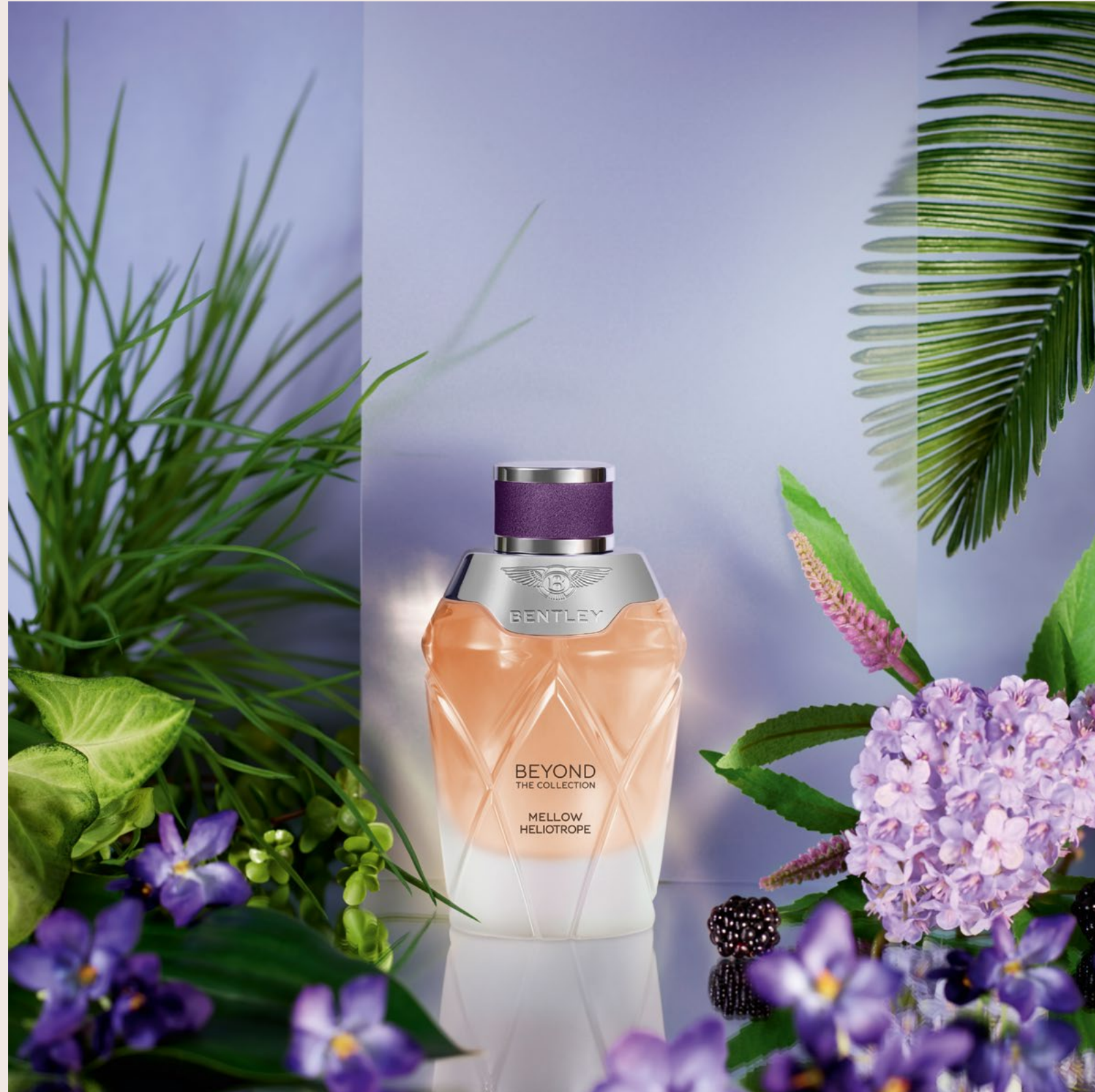
Un Voyage à Lima, au Pérou avec Mellow Heliotrope , une composition florale orientale.