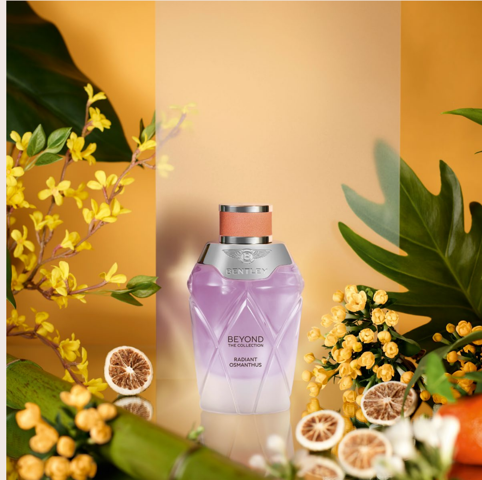
Une escapade à Kyoto, au Japon avec Radiant Osmanthus , une fragrance fruité florale.