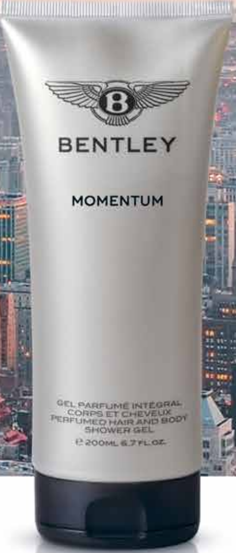
BENTLEY MOMENTUM PERFUMED HAIR AND BODY SHOWER GEL, 200 ml