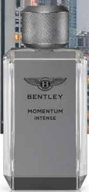
BENTLEY MOMENTUM INTENSE EAU DE PARFUM, 60 ml