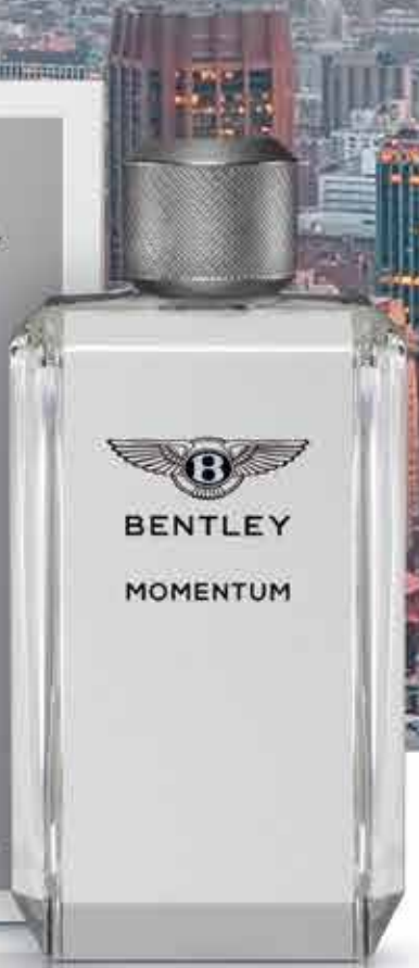
BENTLEY MOMENTUM EAU DE TOILETTE, 100 ml