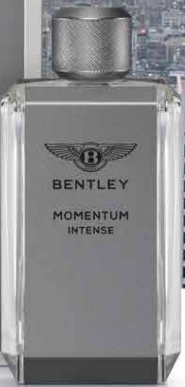
BENTLEY MOMENTUM INTENSE EAU DE PARFUM, 100 ml