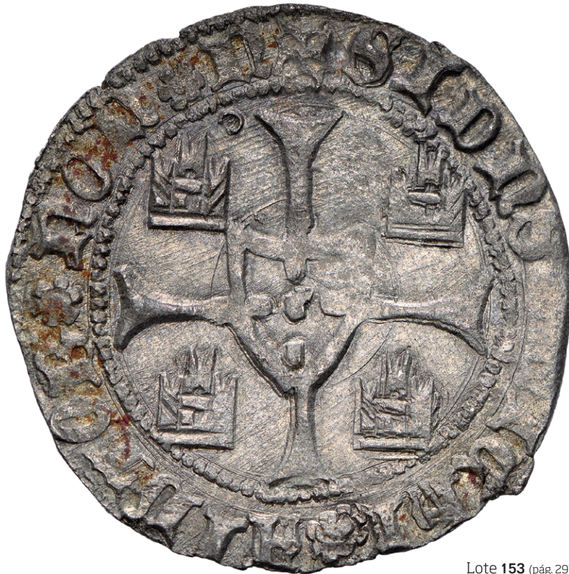
Lote 153 (pág. 29)