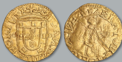
Lote 203 Ouro - Meio São Vicente MBC