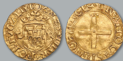
Lote 207 Ouro - Cruzado; L-R MBC