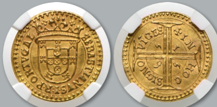
Lote 236 Ouro - Engenhoso 1565 Única, SOBERBA