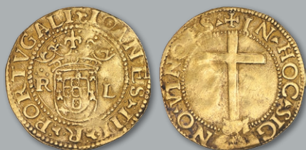
Lote 208 Ouro - Cruzado Calvário; R-L Extremamente Rara, MBC+