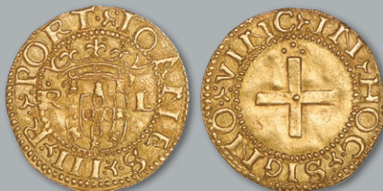
Lote 206 Ouro - Cruzado; R-L Excelente Estado de Conservação, SOBERBA