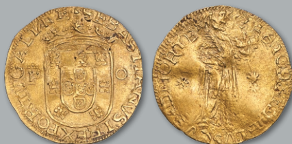
Lote 235 Ouro - São Vicente; P-O MBC+/MBC-