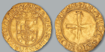
Lote 205 Ouro - Cruzado quase BELA