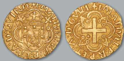
Lote 189 Ouro - Cruzado BELA