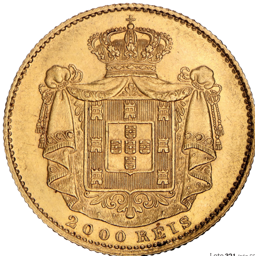
Lote 321 (pág. 50)