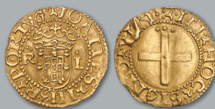
Lote 204 Ouro - Cruzado BELA