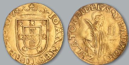
Lote 202 Ouro - Meio São Vicente MBC