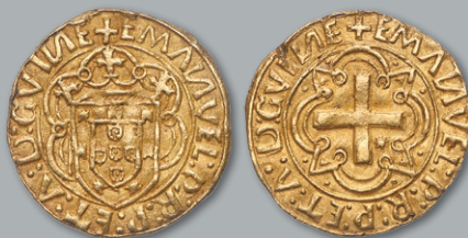
Lote 190 Ouro - Cruzado quase BELA