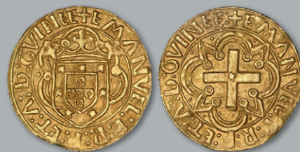
Lote 191 Ouro - Cruzado Excelente Estado de Conservação, SOBERBA