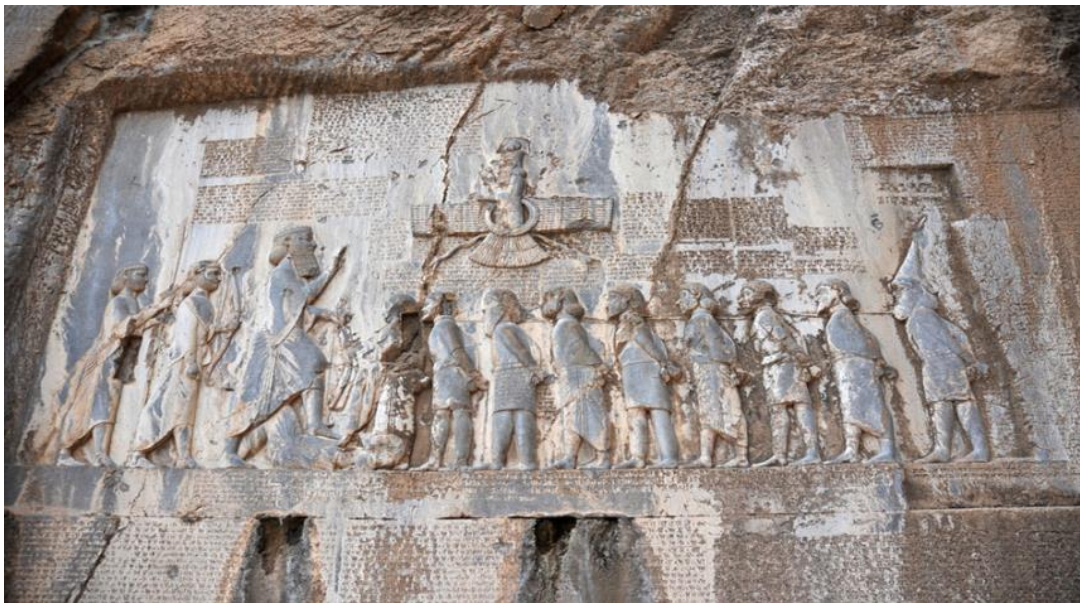
نقش بيستون " مقام الآلهة الإخمينية "

منها : كان للملوك الإخمينيين مقام رسمي ديني تُقام فيه مراسم مكلية متنوعة، يُسمى " مقام الآلهة " بنقش بيستون كما هو مبين في الصورة الآتية. ومعناه " المكان الذي تسكنه الآلهة" . وهذا المقام دليل يشهد بنفسه أن ديانة الملوك الإخمينيين كانت ديانة شركية وثنية ولم تكن ديانة توحيدية ، فهو ليس مقاما لأهورا مزدا فقط ، وإنما هو له بوصفه كبير الآلهة ، ولآلهة أخرى كميثرا وأناهيتا.