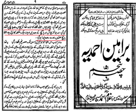
كان من إرادتي أن أكتب هذا الكتاب في خمسين مجلداً ، ولكني أكتفيت على خمسة مجلدات لأنني وجدت أنه لا فرق بين 5 و 50 إلا فرق النقطة ( (براهين احمدية ج 5 ص 9) )

علما بأن القادياني كان قد أخذ سعر الكتاب بخمسين مجلداً وليس خمس مجلدات، لأنه ذكر من البداية أنه سيكتبه في خمسين مجلداً، فالرجل أخذ الحقوق وظلم الذين اشتروا كتابه. ومن مكره وخداعه وغشه وكذبه على الله وعلى الناس أنه غضب عندما طالبه الناس بأموالهم ، فقال لهم: (( هذا مال أعطانيه الله ولا أرد إلى أحد ولو قرشاً، كما لا أجيّب أحداً في هذه المسألة، والذي يسألني عن الحساب فلينبغي أن لا يُعطيني بعد ذلك شيئاً"- إعلان الغلام المنشور في جريدة قاديانية "الحكم" الصادرة : 21 مارس 1905 م. )) .