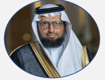
السيرة الذاتية للدكتور عبدالعزیز بن سعد الدغیثر