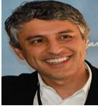
البروفيسور رضا أصلان، باحث أمريكي في مقارنة الأديان

"إن الأفكار الفلسفية التي يطرحها أستاذ من مكتبه الهادئ قادرة على إبادة حضارة بكاملها". الألماني هاينه