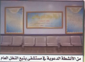
من الأنشطة الدعوية في مستشفى ينبع النخل العام