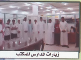
زيارات المدارس للمكتب