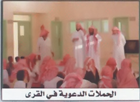
الحملة الدعوية في القرى