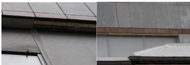
Sl.3.1.2) Oštećenja na fasadi iznad prozora

Zidovi objekta su od betona debljine 25cm, prekriveni termo izolacijom visokih performansi u smislu energetske efikasnosti, kao i dekorativnim kamenim pločama debljine 3cm. Međutim, postoje pozicije koje se sada oštećuju curenjem vode kroz oštećenja na fasadi. Problem je nedostatak mermernih ploča iznad prozora, te tako je ogoljen dio fasade i termoizolacije (sl. 3.1.2). To bi bilo potrebno sanirati. Ukupna debljina spoljnih zidova iznosi 37cm.