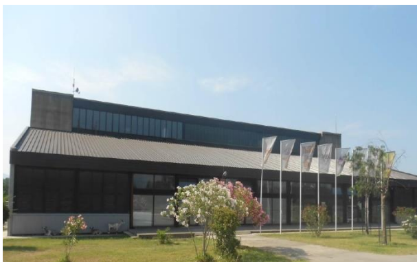
Sl.3.1.4) Objekat sportske dvorane “Župa”

Spoljni zidovi dvorane su od armiranog betona debljine 15cm, koji imaju i noseću ulogu objekta. Na zidovima nema termičke izolacije. Krov zgrade je limeni uz postavljenu izolaciju, ukupne debljine 18cm. Stolarija na objektu je dijelom drvena i dotrajala, jedan dio prozora se usled oštećenja i dotrajalosti ne može otvoriti, zaptivni materijal je gotovo potpuno van funkcije.