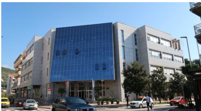
Sl.3.1.1) Nova zgrada Opštine

Nova administrativna zgrada Opštine je savremeni objekat izgrađen 2010. godine i kao takav načelno ispunjava sve kriterijume energetske efikasnosti (Sl.3.1.1). Ukupna neto površina objekta je oko 3954,58 m 2 a računajući prosječne visine prostorija unutar objekta njegova neto zapremina je oko 17490,14m 3 ( podaci preuzeti iz detaljnog energetskeg pregleda izradjenog decembra 2019.g) Radno vrijeme radnim danima u objektu je od 7:00 do 15:00, osim dežurstva koje je dvadesetčetvoročasovno. Grijana površina objekta je u cjelosti 3954,58m 2 , a ukupan broj korisnika je oko 200.