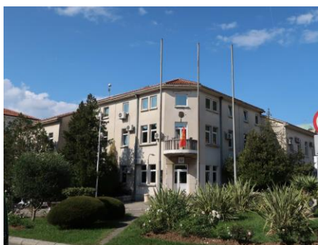
Sl.3.1.3) Stara zgrada Opštine

Ukupna površina objekta je 1667,68m 2 (suteren 154,56m 2 , prizemlje 505,16m 2 , prvi sprat 505,74m 2 , drugi sprat 502,22m 2 ). Broj korisnika objekta nije moguće koncizno odrediti jer je promjenljiv, s obzirom da se u tom objektu, pored pojedinih opštinskih i državnih službi, nalazi i Fakultet za mediteranske poslovne studije i sjedišta pojedinih političkih partija. Okviran broj korisnika koji uzimamo kao parameter je 70. Administracija lokalne samouprave je objekat koristila do juna 2010. godine, a nakon toga samo pojedine službe koristile su dio prostorija u staroj zgradi, a od kraja 2020. godine sve službe opštinske administracije su u novoj zgradi Opštine. Dio potkrovlja se i dalje koristi za čuvanje arhivske građe Opštine Tivat. Ostatak prostorija je ustupljen na korišćenje pojedinim organizacijama i državnim organima: Vodacom, Fakultet za poslovne mediteranske studije, nevladine organizacije, pojedine političke partije i jedinica Poreske uprave i Uprave za nekretnine.